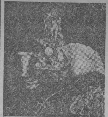
«Bodegón de lujo» Julio Fernández Salazar