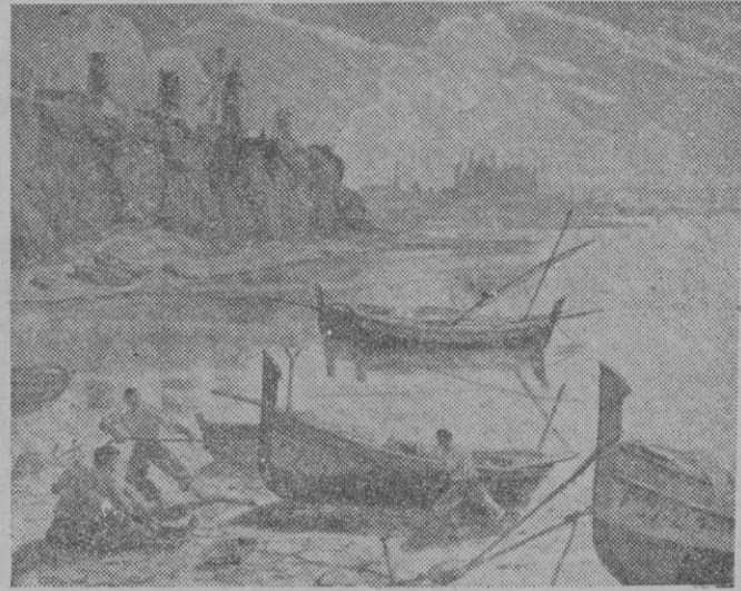
«Puerto de Palma». — A. Truyol.

Reunido en el día de hoy el Jurado designado por el «Círculo de Bellas Artes» para calificar las obras presentadas a su II Salón de Otoño, acordó el siguiente