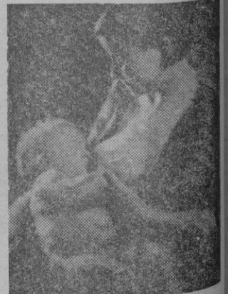
«Maternidad» de Isabel Pons Iranzo.