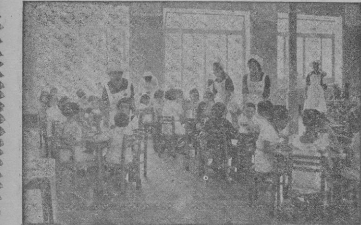
Hora de la comida en un comedor infantil.

obra arquitectónica del camarada Roca, Arquitecto de la Oficina Sindical del Hogar. Con dicha mejora se dará cabida a 50 beneficiarios más. Aspiración de esta Delegación es la creación de nuevas Guarderías que permitan la separación de sexo y el tránsito a Hogares de Aprendizajes, como es similar de la Península. También lo es, la creación de