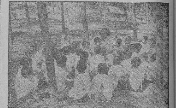
Niños bajo los pinos.

Auxilio Social, no tiene más fuentes de ingresos directos en las provincias que el importe de las Postulaciones, la Ficha Azul y los Donativos eventuales que se hacen a la Obra. En un año se han recaudado, por el primer concepto 270.768.15 pesetas, correspondientes a 902.556 emblemas colocados.