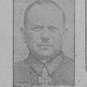
El General Heinz Guderian, creador de los tanques en el Ejército alemán y que ha sido nombrado por el Führer Inspector General de la Arma acorazada.

Un total de 14 cuatrimotores fueron derribados por los cazas nocturnos, la DCA naval y la DCA de la aviación.