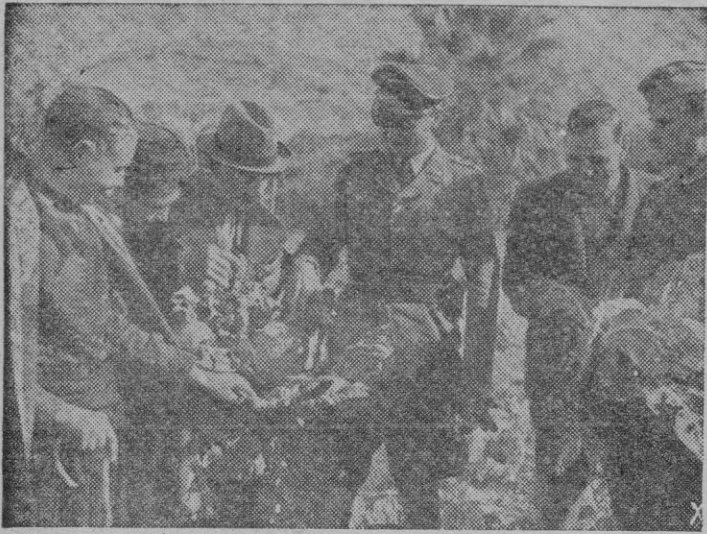
Los alemanes llevan a cabo en la gran isla de Creta una eficaz reorganización agrícola. Los labradores enseñan a los soldados alemanes los frutos de sus recientes y acrecentadas cosechas