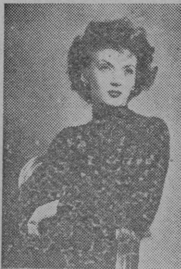
Jersey de punto con cuello alto y mangas con líneas transparentes.—Va adornado con perlas doradas bordadas en forma de aros enlazados.

Igualmente se ven grandes puños de piel en las mangas sin otro detalle de piel en el abrigo o una ancha tira algo más alta que la cintura. Desde luego, también se lleva en los sitios de costumbre, bien un gran cuello smoking o solapas cortas y an-