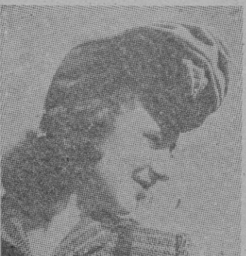
Modelo de turbante anudado fantásticamente sobre la frente.

chas de piel de pelo largo y duro, con detalles en los bolsillos.