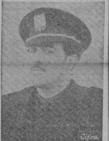
Los Ministros de Agricultura y Trabajo, que presidieron los actos de ayer en Valladolid. Texto del discurso de Girón, en séptima página.