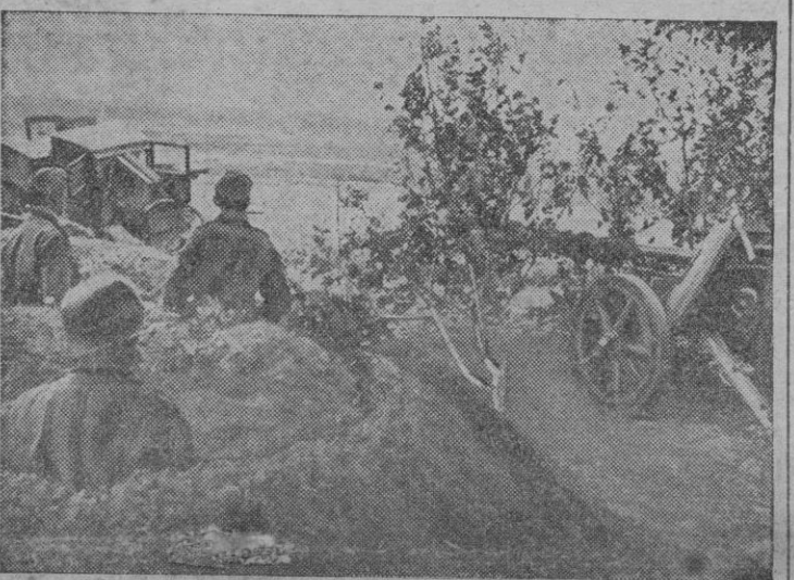
Una posición antitanque alemana en la región de Moscú, pronta a entrar en acción ante cualquier intento enemigo