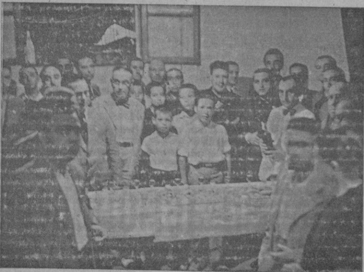
En nuestra casa, redactores y operarios de la imprenta a la hora del lunch