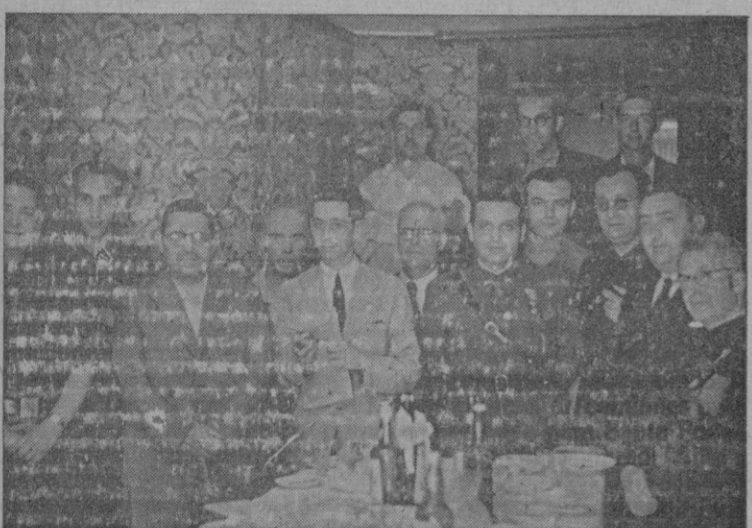
También el Jefe de Propaganda visitó «El Hogar del Porvenir»