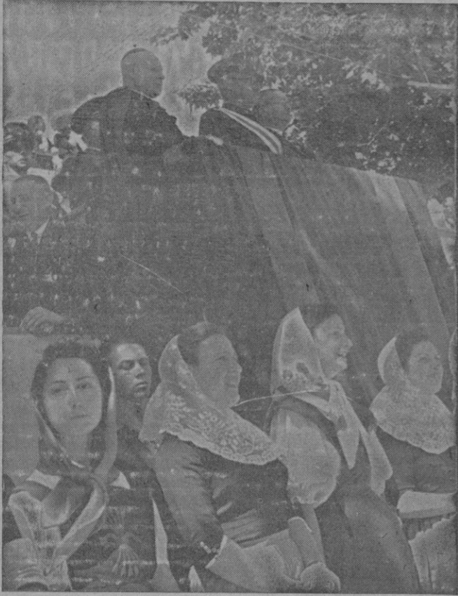
La tribuna de las Autoridades durante el desfile

El barco que transportará los valores es el «Monte Albato».