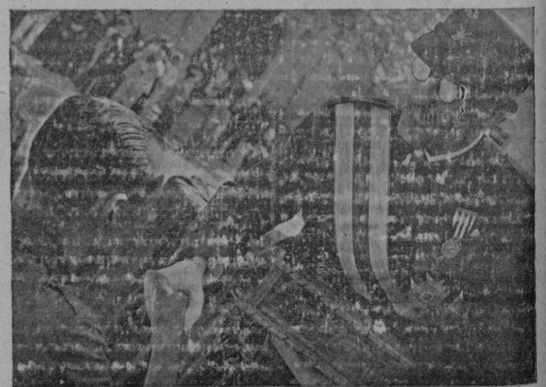
El General Cánovas estrecha con orgullo una mano trabajadora