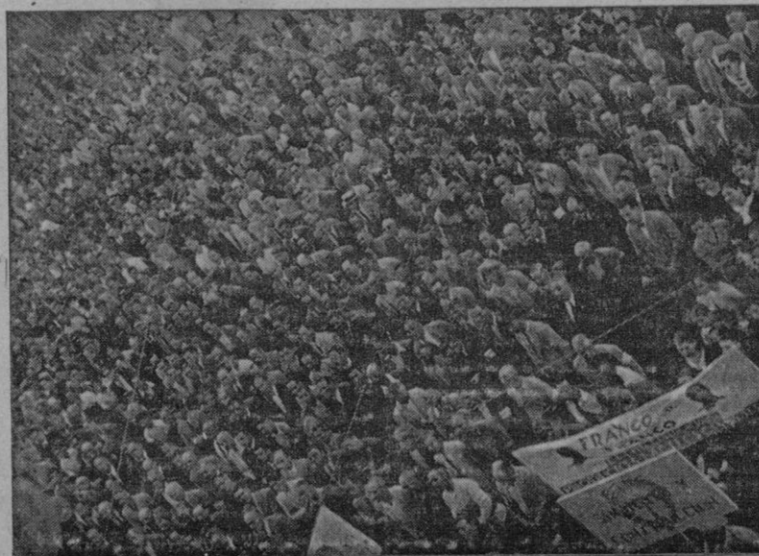
Esta fué la multitud que, bajo el guión de la C. N. S. reunióse en Cort