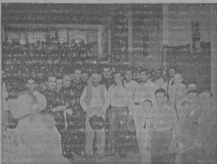
Nuestras Jerarquías en los almacenes de Bernardino Seguí