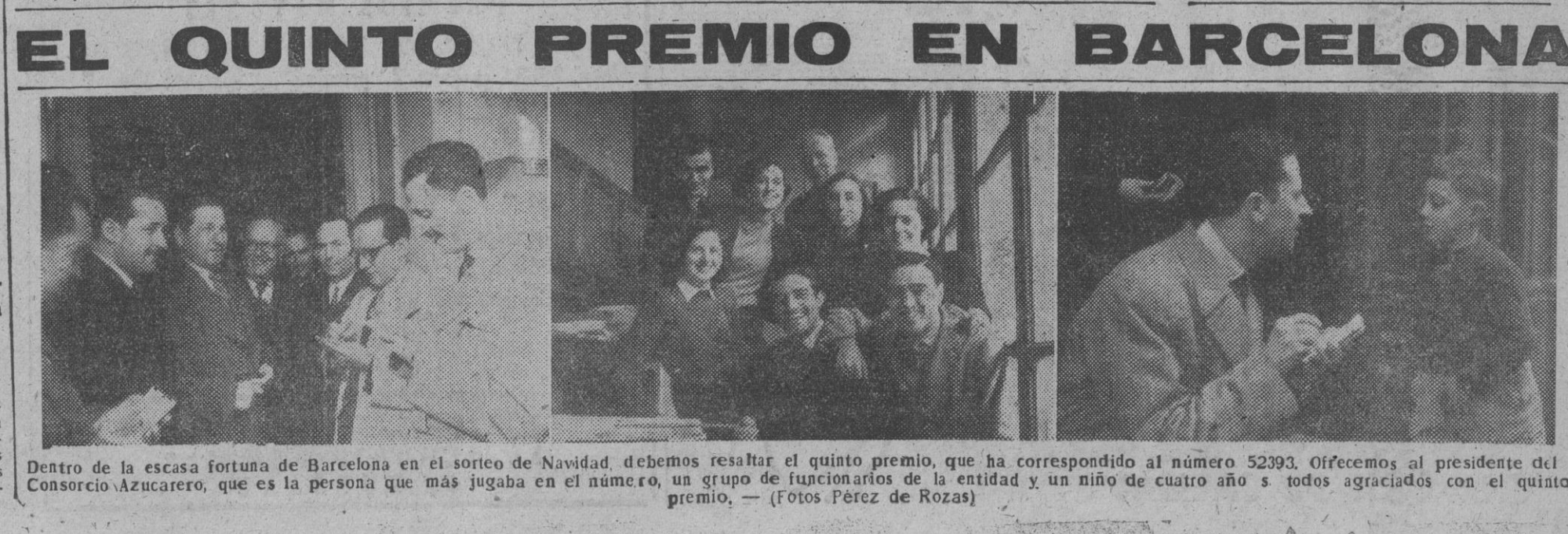
El quinto premio de 500.000 pesetas, que ha correspondido al número 52393, ofrecemos al presidente del Consorcio Azucarero, que es la persona que más jugaba en el número, un grupo de funcionarios de la entidad y un niño de cuatro años todos agraciados con el quinto premio.