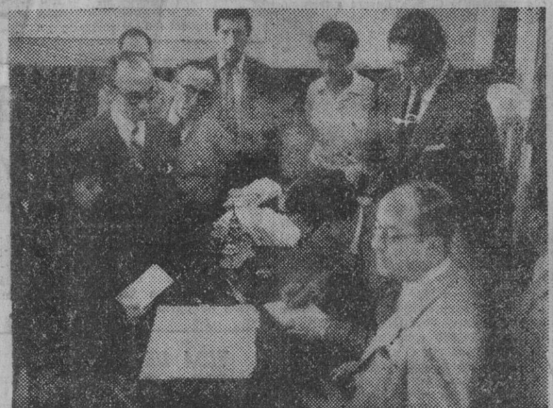
Acto de entrega de los jornales correspondientes a los días no trabajados, a los obreros o parientes de los fallecidos de la fábrica de cerámica que resultó destruida por la explosión.