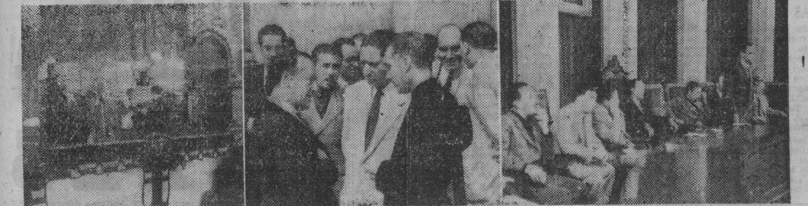
I. El señor Sanz Orrio, durante la entrega de la lámpara votiva de los Sindicatos barceloneses a la Virgen de Montserrat. — II. El gobernador civil, señor Baeza Alegria, a la salida del Santuario de Montserrat, con el delegado nacional de Sindicatos. — III. El delegado provincial de C. N. S., — (Fotos Pérez de Rozas)