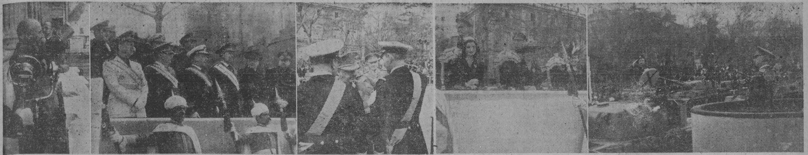
1. El Jefe del Estado, desde el balcón principal del Palacio Nacional, agradece las manifestaciones de adhesión y júbilo de la multitud que, congregada en la Plaza de Oriente, tributa a su persona. — 2. El Gobierno español en pleno contempla desde la tribuna el gran desfile militar que se celebró ante S. E. con motivo del VIII aniversario de la Victoria. — 3. El Caudillo impone varias condecoraciones a jefes y oficiales de las distintas Armas que más se distinguieron en la Cruzada. Momento de imponer la Laureada de San Fernando a un comandante de Marina. — 4. La señora de S. E., doña Carmen Polo de Franco, y su hija Carmen, en el palco de honor de la tribuna levantada ante la del Jefe del Estado, viendo el paso de las fuerzas. — 5. El Generalísimo Franco presenciar el desfile. — (Fotos Ortiz y Cifra)