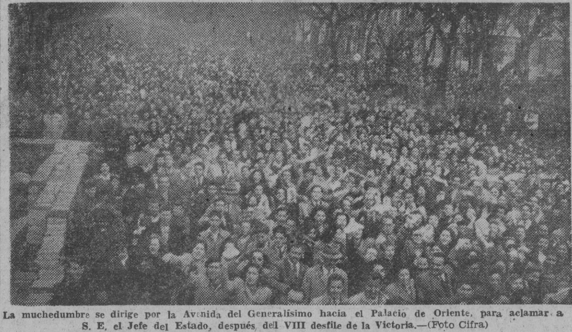
La muchedumbre se dirige por la Avenida del Generalísimo hacia el Palacio de Oriente, para aclamar a S. E. el Jefe del Estado, después del VIII desfile de la Victoria.