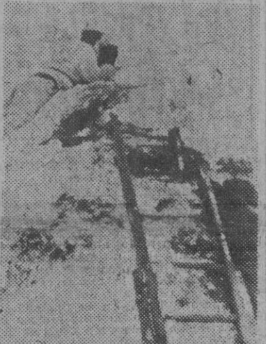
Un jefe de formaciones blindadas del Ejército alemán, observado los movimientos del adversario.