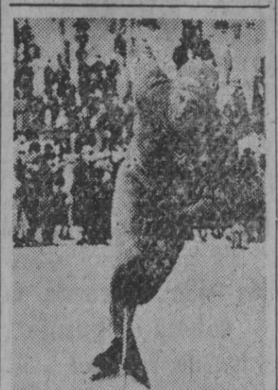
El noruego Engnestangen recorrió en la defensa de su campeonato recientemente celebrado, sobre 500 metros en 46 segundos, y los 3.000 metros en 31 minutos 38 segundos