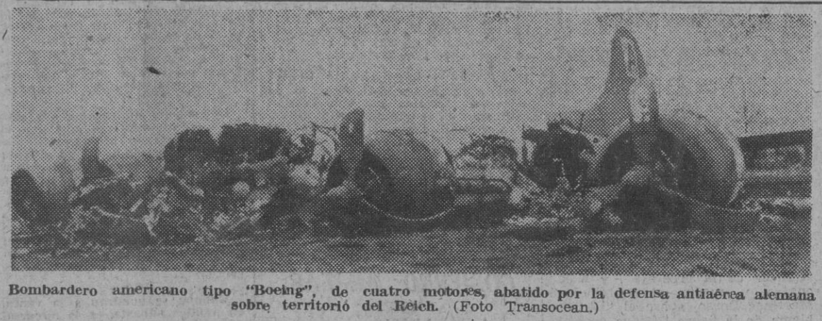
Bombardero americano tipo "Boeing" de cuatro motores, abatido por la defensa antiaérea alemana sobre territorio del Reich.