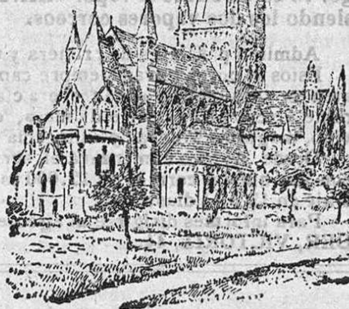
La Catedral de Troughjen

De desear es que el nuevo soberano proporcione a su pueblo todas las venturas y prosperidades a que es merecedor por su laboriosidad y honradez; pero no es señal muy satisfactoria la de que todos los estados europeos se hayan hecho representar más ó menos pomposamente en la ceremonia de la coronación, excepción hecha de uno, un pueblo hermano, Suecia, que sin duda resentido aún por la separación de Noruega, no ha creído lógico participar de los festejos a que hoy viven entregados los noruegos.