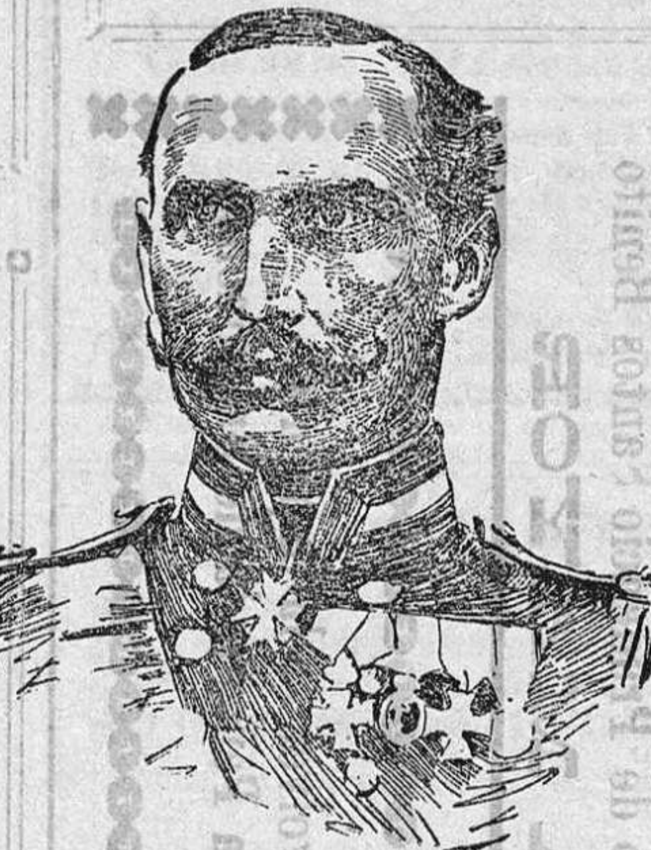
Haakon VII de Noruega