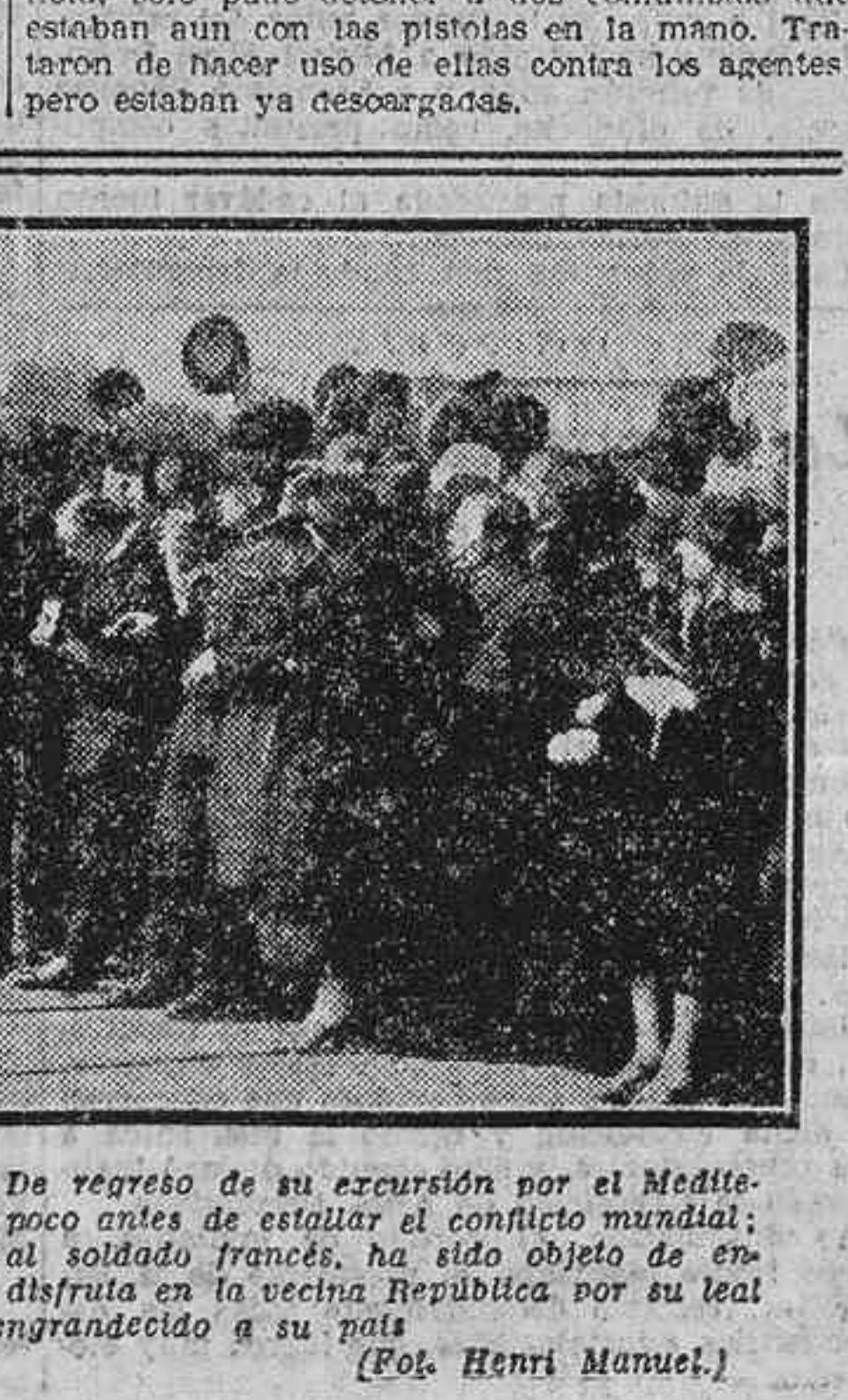
El rey Jorge de Inglaterra ha visitado por tercera vez, desde que cifre la corona, Francia. De regreso de su excursión por el Mediterráneo, este monarca, modelo de reyes constitucionales, había estado en París el año 1913, poco antes de estallar el conflicto mundial...