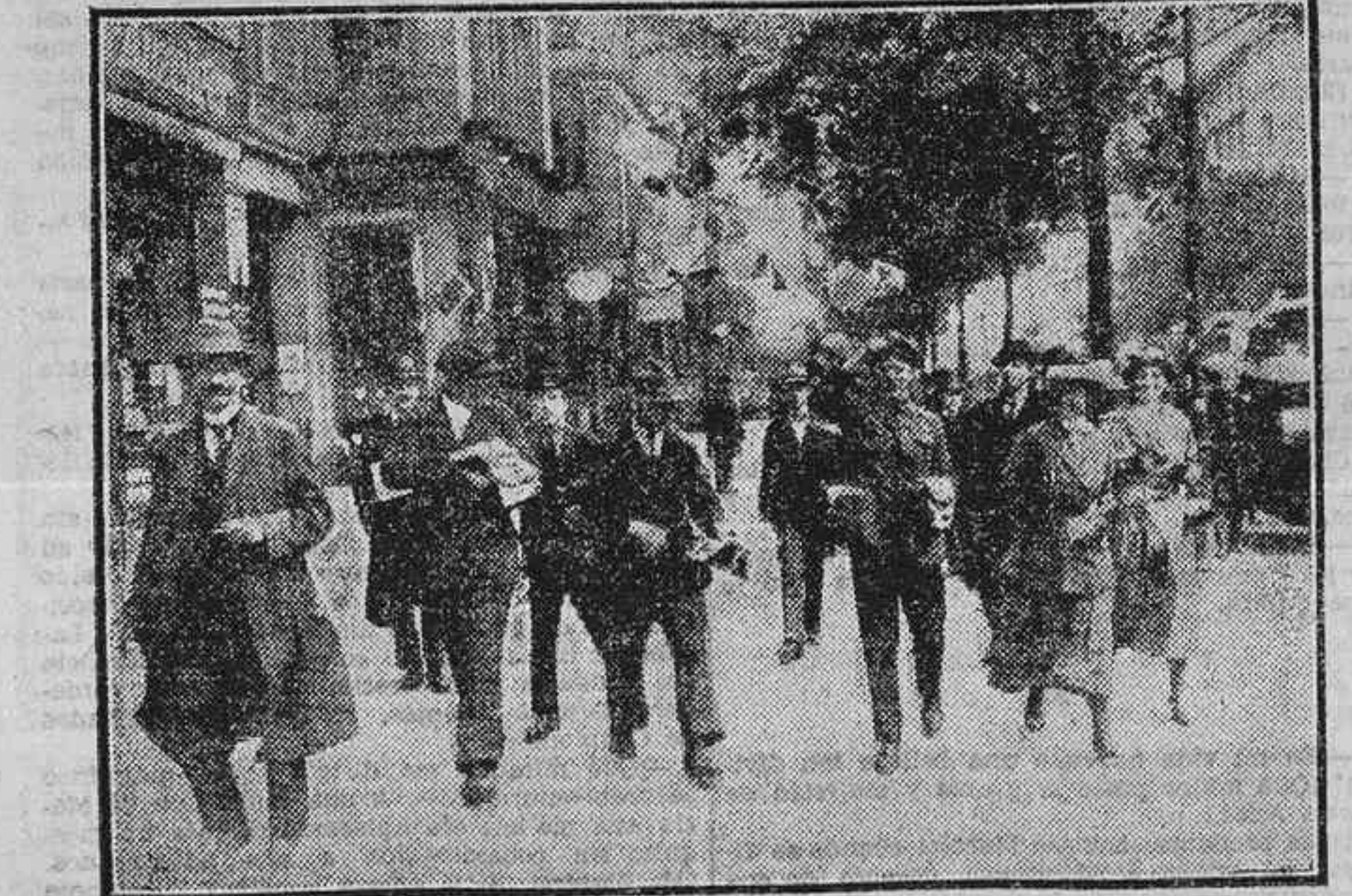
LAS ELECCIONES ALEMANAS.-Los propagandistas de la candidatura de Marx distribuyendo proclamas por las calles de Berlín.

El domingo se celebró en el teatro del Centro el anunciado mitin organizado por la Asociación de Vecinos. Hablaron los Sres. Monzó, Acevedo y Salazar Alonso.