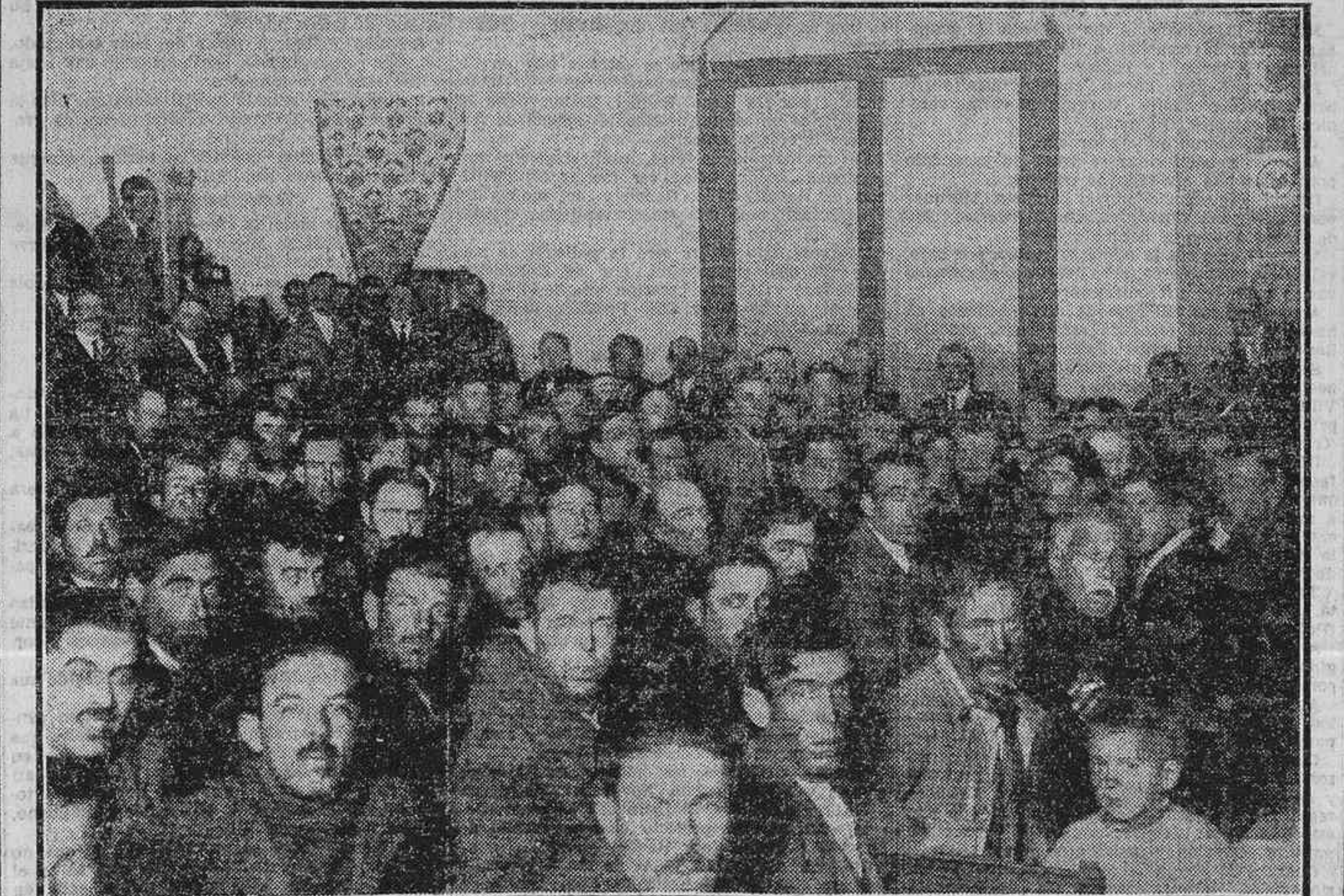
ASPECTO QUE OPRECIABA ANOCHE EL TEATRO DE CARABANCHEL ALTO DURANTE EL MITIN ORGANIZADO POR LA FEDERACION LOCAL DEL RAMO DE CONSTRUCCION...