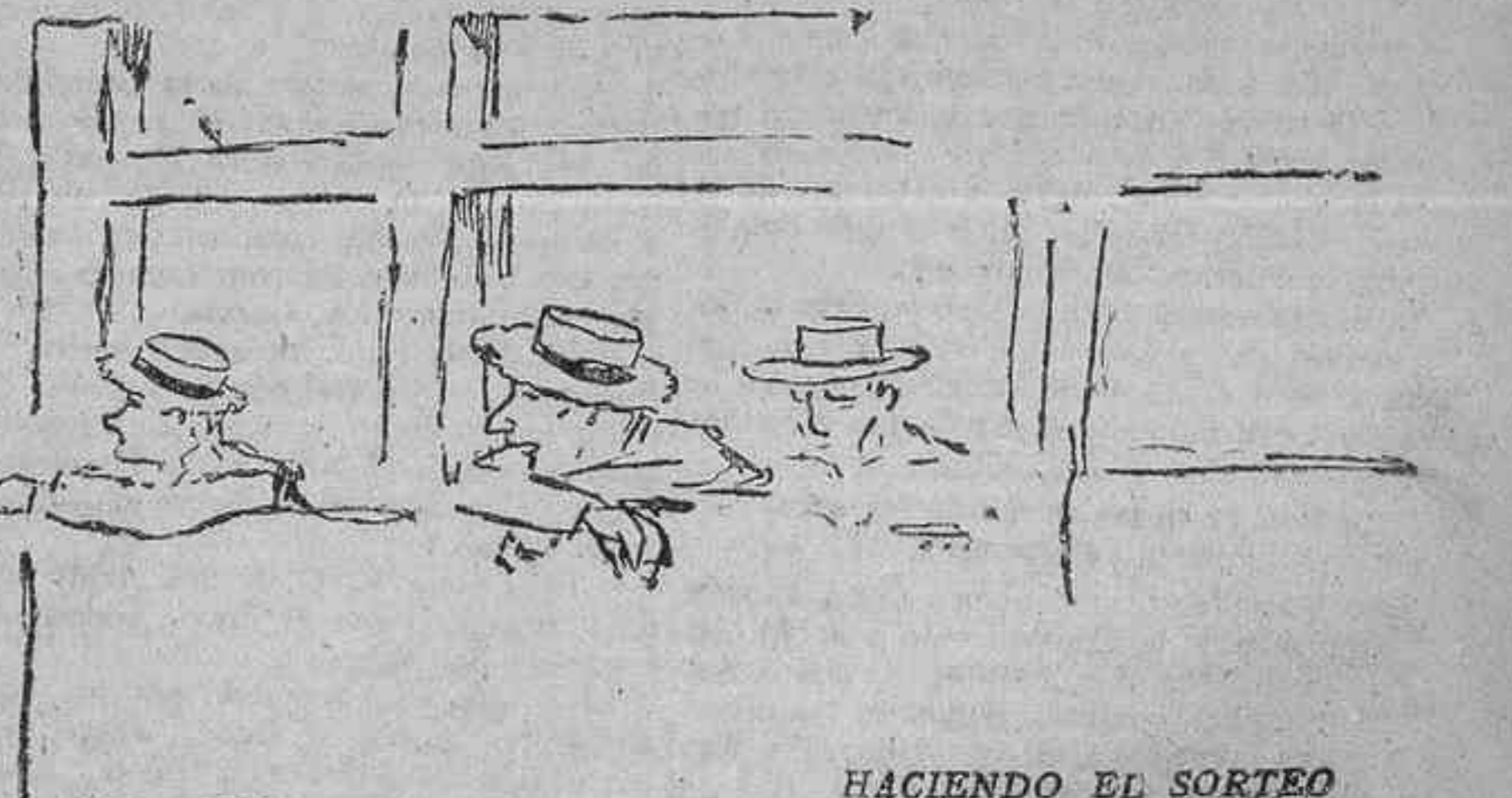
HACIENDO EL SORTEO