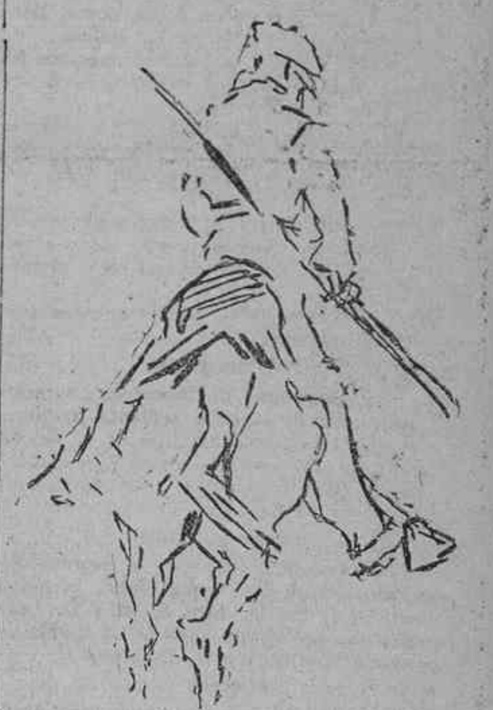
UN PICADOR EN LA PRUEBA

Y como siempre hay un toro—entre los seis o los ocho que van a lidiarse—de fea construcción (con las agujas altas, demasiadas defensas, más peso que los otros, etc., etc.), los sorteadores pasan la agonía co-