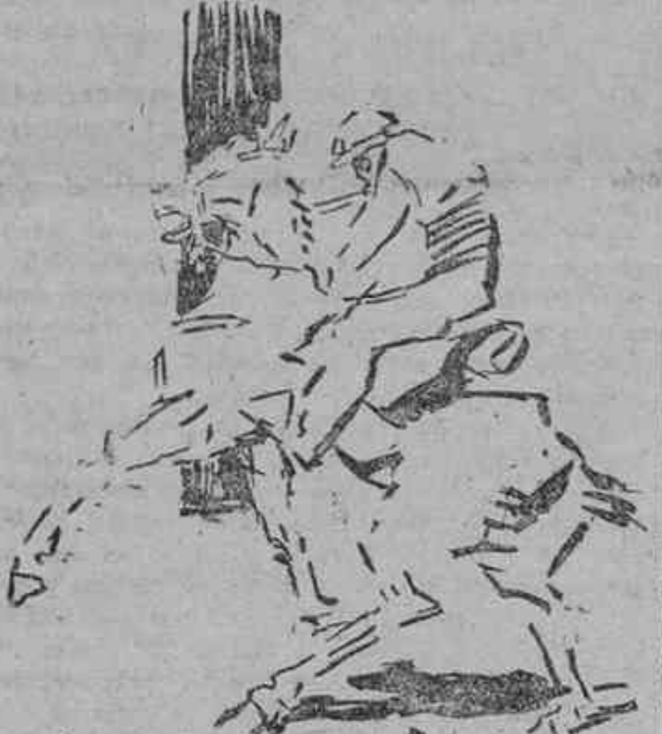
LA PRUEBA DEL CABALLO

Sucede muchas veces que el toro más grande, de más defensas, más hondo y más corto de agujas, es el que sale más bravo y más noble, y sucede también que el torero, víctima de su prejuicio, no se arrima ni en bro-