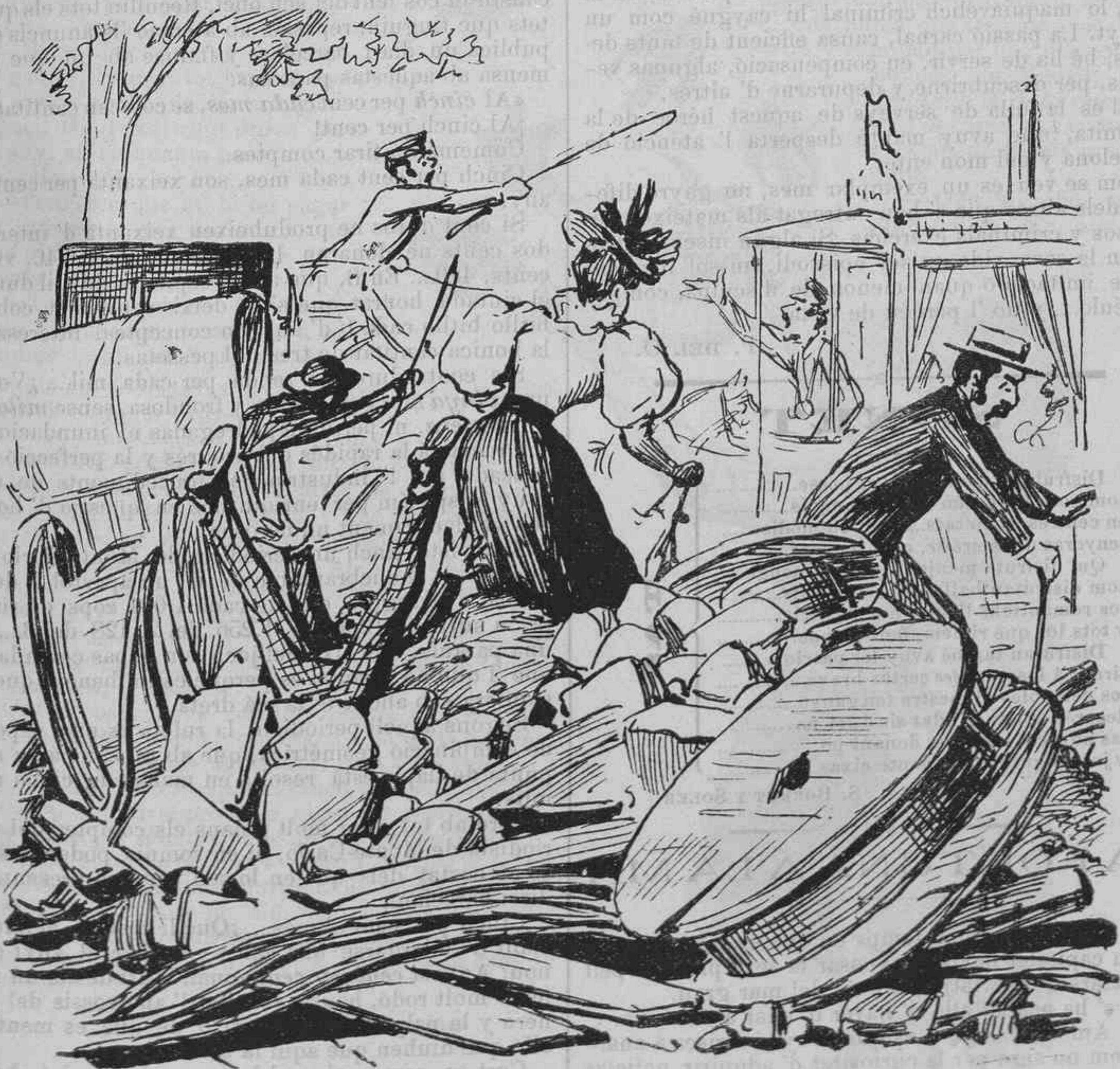
Lo pas de la trocha.