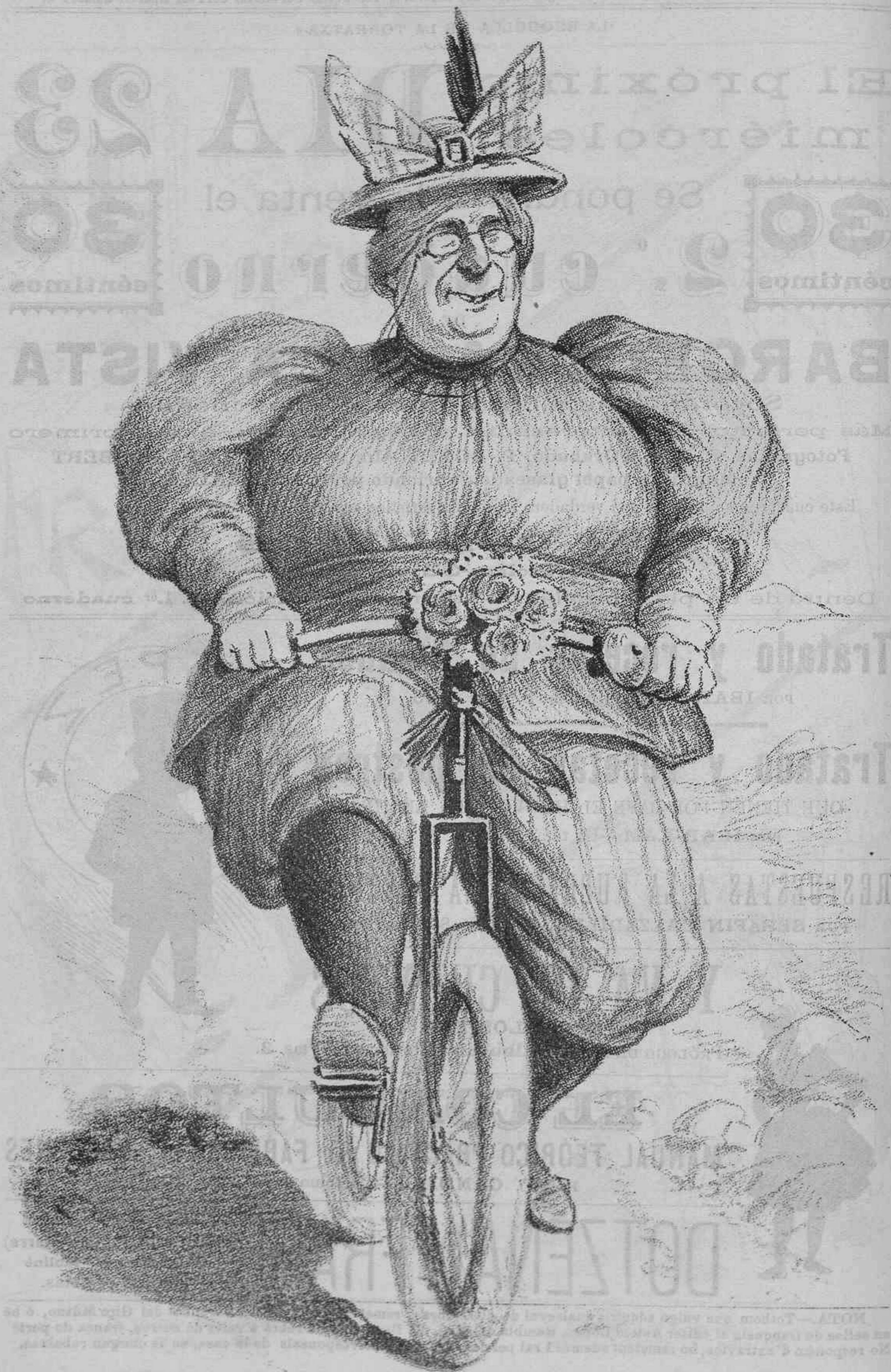
Son pedal no falla, lo seu tren no 's torsa; es una ciclista de primera forsa.