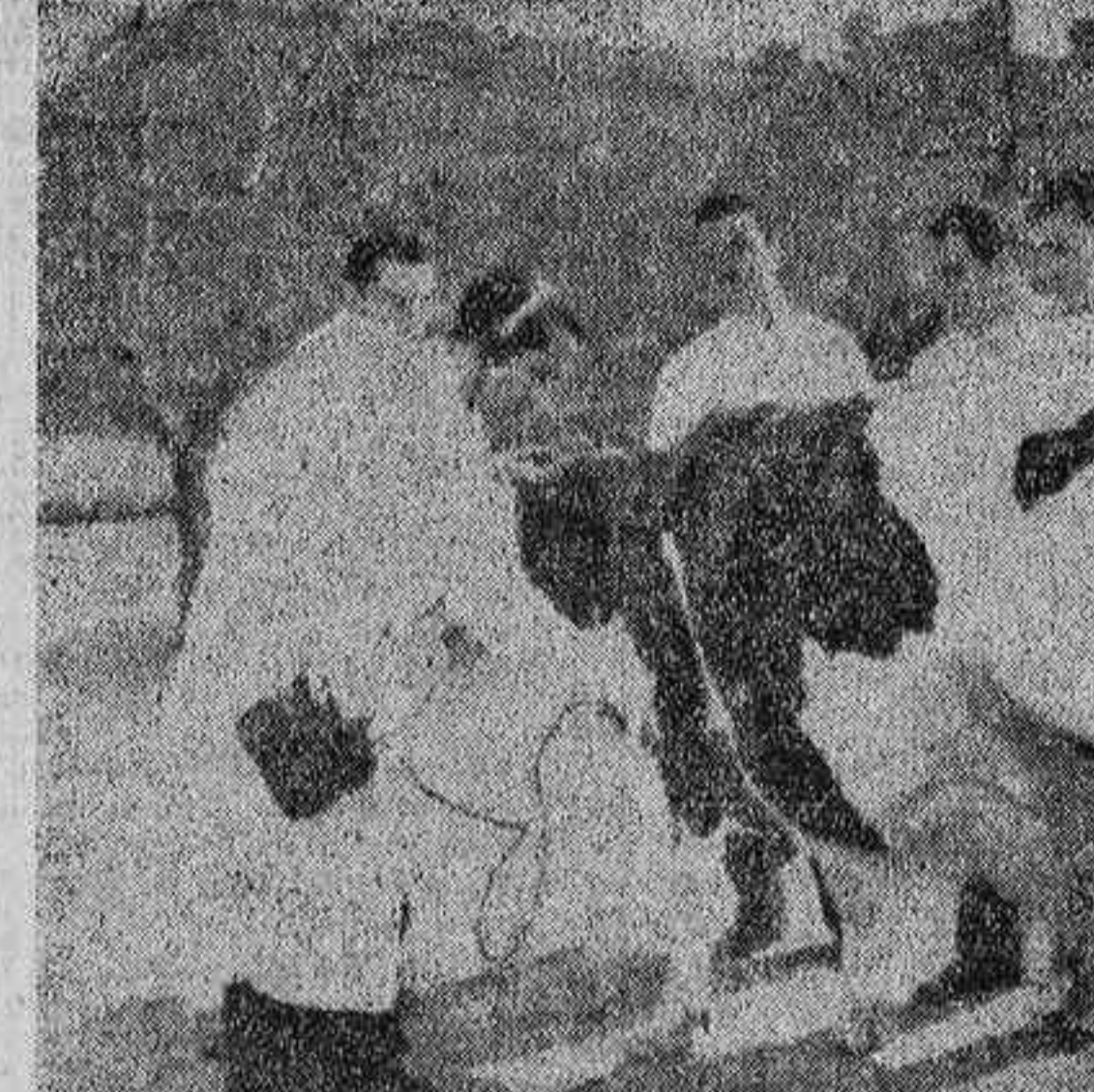
Alumnos de la catedra ambulante de la Facultad de Veterinaria de Madrid, durante un diagnóstico electrónico de cuerpos extraños metálicos, mediante un detector que permite localizarlos en el interior de los animales...

Un detector de metales permite localizar cuerpos extraños en el interior de los animales