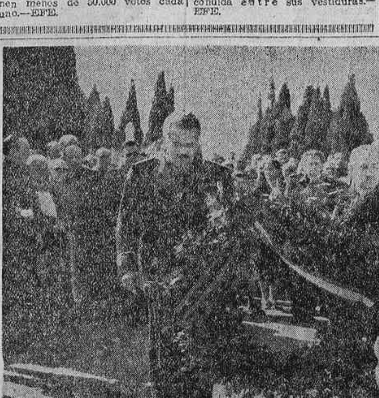
Los señores secretario general del Movimiento, señor Arrese, y de Trabajo, señor Girón, en el cementerio de Valladolid, al ir a depositar una corona de laurel en el mausoleo donde reposan los restos de Onésimo Redondo.