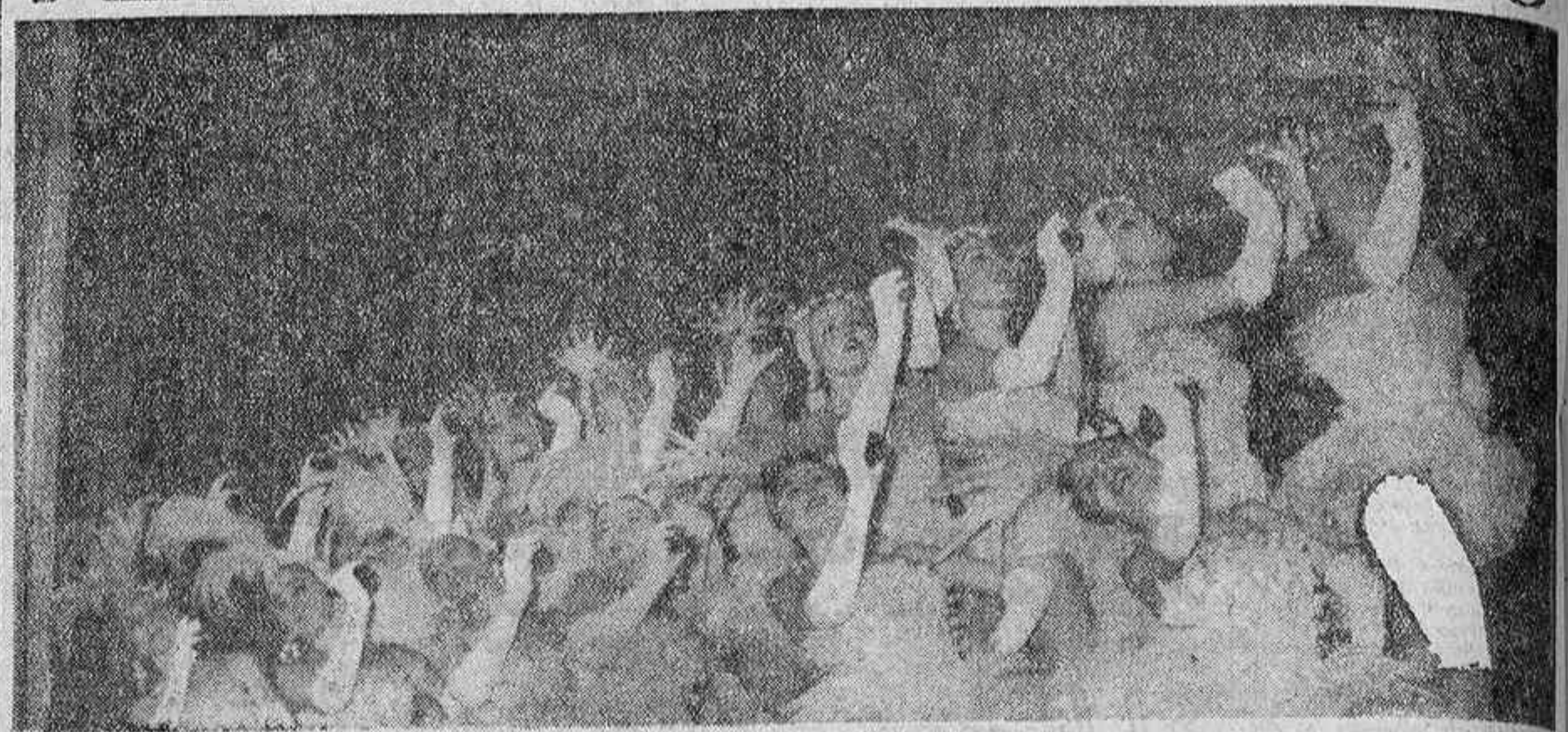
Lo mejor, para las mejores. Es decir, "POMINA" para las chicas de Celia Gámez. Y las chicas de Celia Gámez son carteras de no descomponer la armonía del grupo—que capta exactamente Torremocha—para, terminada la función, dedicarse a... la mejor bebida, intensiva por el corto, del mundo

La invasión: "POMINA" invadió el teatro Maravillas. "El Águila de Fuego" recibió la cordial, espléndida, generosa visita, que he actuado, ésta es la mejor. En ella espero prosperar.