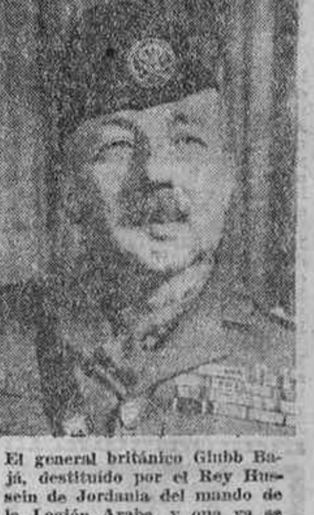
El general británico Glubb Bacha, destituido por el Rey Hussein de Jordania, en su momento de jefe de la Legión Árabe, y que ya se encuentra en Londres.

LONDRES, 4.— A la llegada del general Glubb Bacha, destituido por el Rey Hussein como jefe de la Legión Árabe de Jordania, había en el aeropuerto, esperándole,