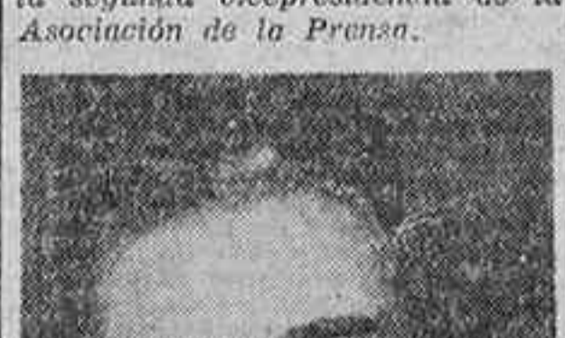
Don Victor de la Serna, premio Luca de Tena.