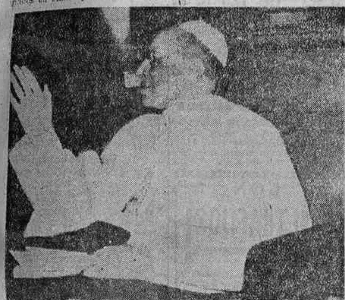
El Santo Padre Pio XII, que ayer recibió en audiencia colectiva a los representantes diplomáticos de 42 países, con ocasión del octogenario aniversario de su natalicio y el decésimo de su pontificado. Es ésta la más reciente fotografía del Santo Padre.

CIUDAD DEL VATICANO, 4.— Los representantes de 42 naciones han tributado hoy tributo a Su Santidad el Papa Pio XII con motivo del octogenario aniversario de su nacimiento.