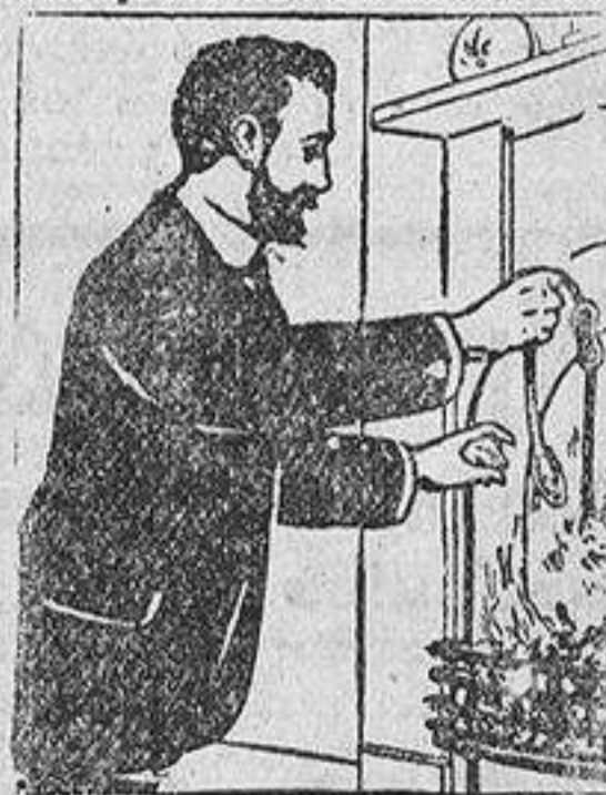
Cura su quebradura y eche el bragueros al fuego.

Se han hecho arreglos para que á todos los lectores de La Correspondencia de España que sufran de quebradura se les envíen completos detalles acerca de este invaluable descubrimiento, sin coste alguno, y se confía que todos los que lo necesitan se aprovechen de esta generosa oferta. Basta sólo llenar el adjunto cupón y enviarlo por correo á la dirección que se indica: