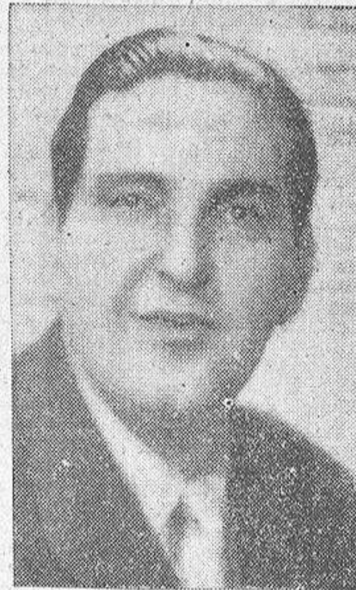
JOAQUIN DEUS, el notable bajo coruñés, insustituible en las formaciones de ópera en nuestra patria, que se dio a conocer brillantemente en el "Cuarteto de madrigalistas españoles", y que acaba de obtener sonados éxitos en Portugal.

—La temporada se desarrollará con arreglo al siguiente calendario: presentación con "Aida", en función de noche, el miércoles, 11 de agosto. A continuación, "Lucía de Lammermoor", "Andrea Chenier", "La bohème" y "Rigoletto". En funciones de tarde, y despedida con "Carmen", en