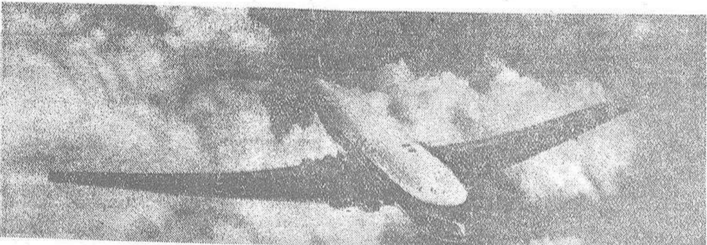
—Este es el famoso avión inglés, tipo Havilland "Comet", el más rápido del mundo, que ha hecho el recorrido Londres-Nueva York y regreso en siete horas. La compañía British Overseas Airways ha adquirido estos aparatos de este tipo para ponerlos en servicio, bajo el lema de "Visite Nueva York y regrese en el mismo día".