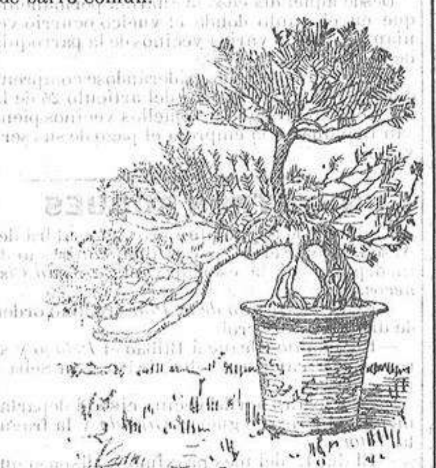
Fig. 2.ª.—Pino de 200 años de edad

Entre dichas plantas figuraban las dos que representan nuestros grabados. La Fig. 1.ª es una tuya ( Chamaecyparis obtusa ) que ha sido vendida por la respetable suma de 1.300 francos. Apesar que cuenta más de un siglo de vida y que al estado natural es un árbol robusto que mide con frecuencia 25 metros de altura, sin embargo planta y tiesto no llegan a un metro. Todas estas plantas están cultivadas en hermosos tiestos de porcelana y no de barro común.