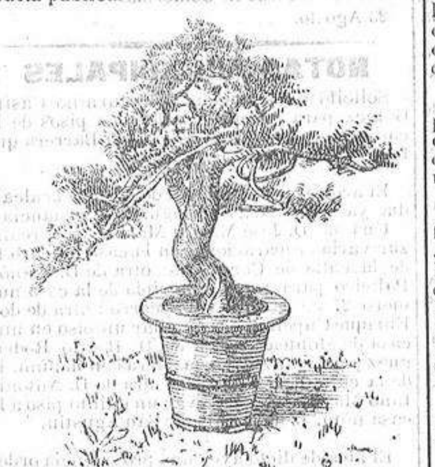
Fig. 1.ª.—Tuya japonesa (vendida 1.300 francos)

Entre dichas plantas figuraban las dos que representan nuestros grabados. La Fig. 1.ª es una tuya ( Chamaecyparis obtusa ) que ha sido vendida por la respetable suma de 1.300 francos. Apesar que cuenta más de un siglo de vida y que al estado natural es un árbol robusto que mide con frecuencia 25 metros de altura, sin embargo planta y tiesto no llegan a un metro. Todas estas plantas están cultivadas en hermosos tiestos de porcelana y no de barro común.