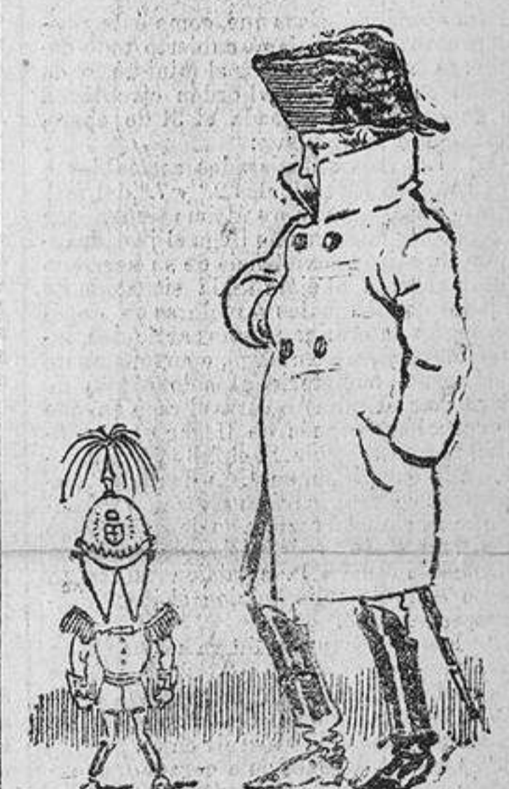
Según el marqués de Apezteguia, el general Weyler viene a ser en la escala na poleónica un 005.