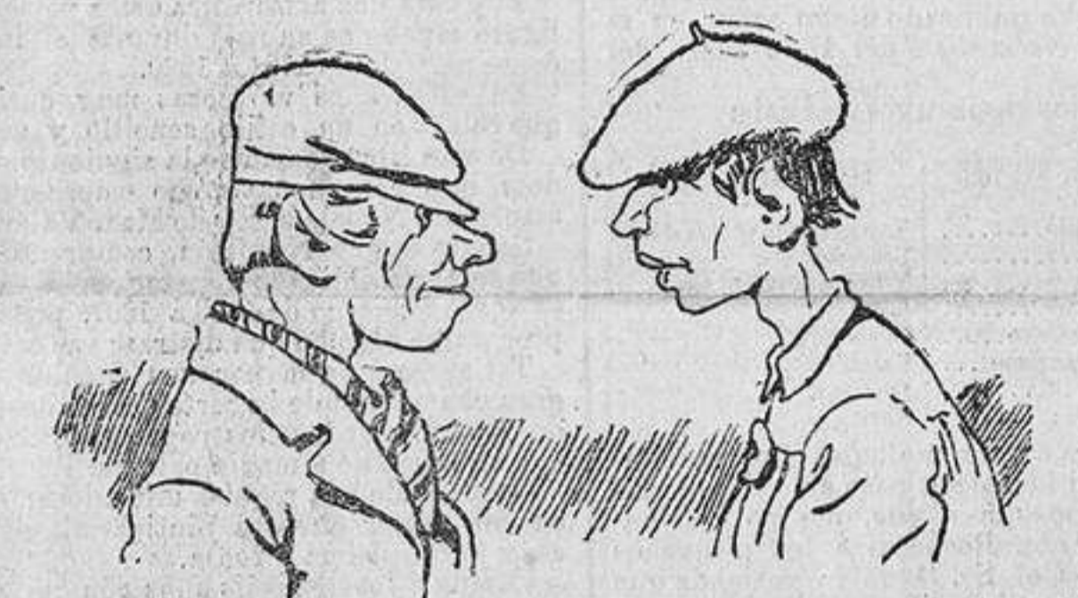
—Te has enterado de la temperatura en los Estados Unidos? En Chicago y en Nueva York en estos últimos días ha bajado el termómetro a 36 grados bajo cero. —Me alegro, porque con semejante temperatura se habrán enfriado mucho sus relaciones con los laborantes cubanos.