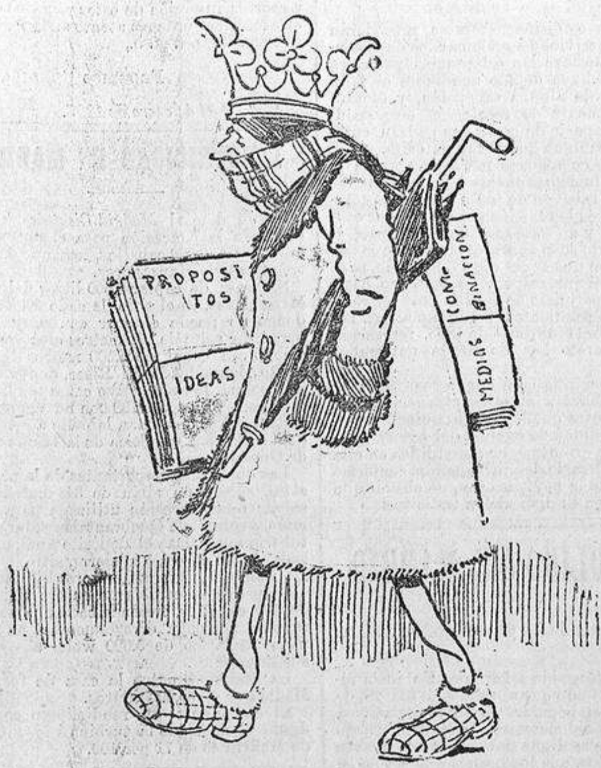
Con su reciente venida nos tiene en expectación el marqués de Apezteguia.