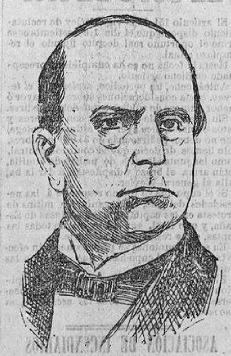
En la Presidencia.

ma de sus amigos políticos para la contienda electoral. En las primeras elecciones generales, posteriores al suceso de Buffalo, el partido sufrió una de las mayores derrotas que registra la historia política de la República norteamericana.