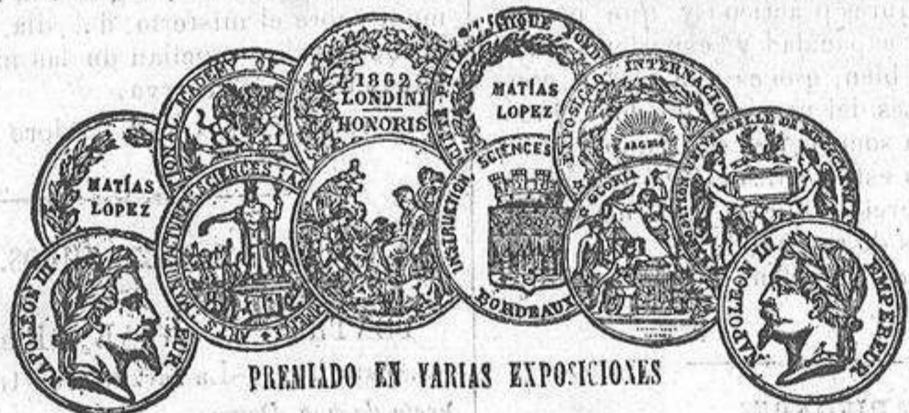
PREMIADO EN VARIAS EXPOSICIONES

Los remedios se venden en cajas y botes, por todos los principales boticarios del mundo entero, y por su propietario, el Profesor HOLLOWAY, en su establecimiento central, 533, Oxford Street, (antes 244, Stran.) Londres.