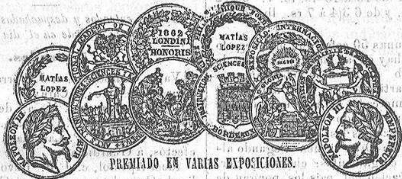
PREMIADO EN VARIAS EXPOSICIONES.

Los martes a las 4 de la tarde, para Cartagena, Almería, Málaga, Cádiz y Sevilla. A la misma hora para Valencia, Barcelona y Marsella. Admite carga y pasajeros. Consignatarios, Sres. Faes hermanos y compañía.