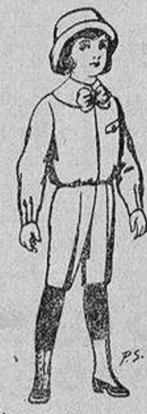
Trajes patén para niños de 4 a 9 años De 5 a 5'50 ptas.