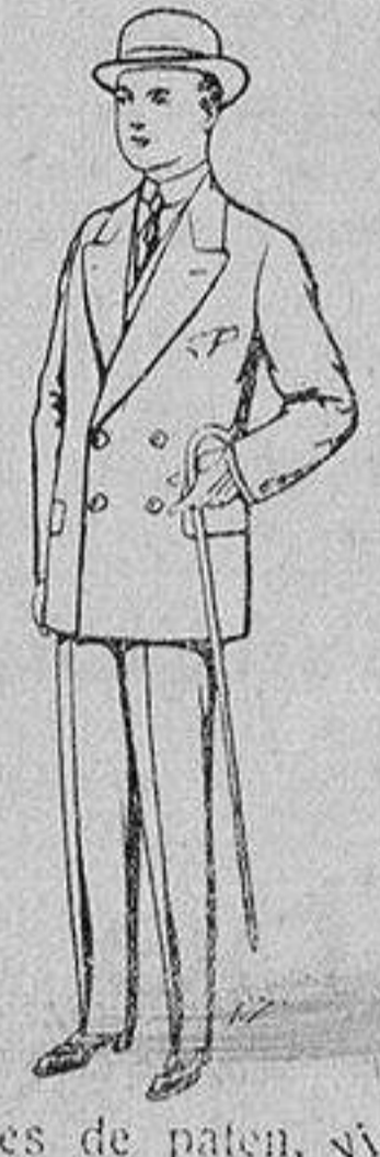
Trajes de patén, cuñaj etc., para niños de 10 a 16 años De 25 a 48 pesetas.

Ropas confeccionadas para Caballero, Señora, Niño y Niña