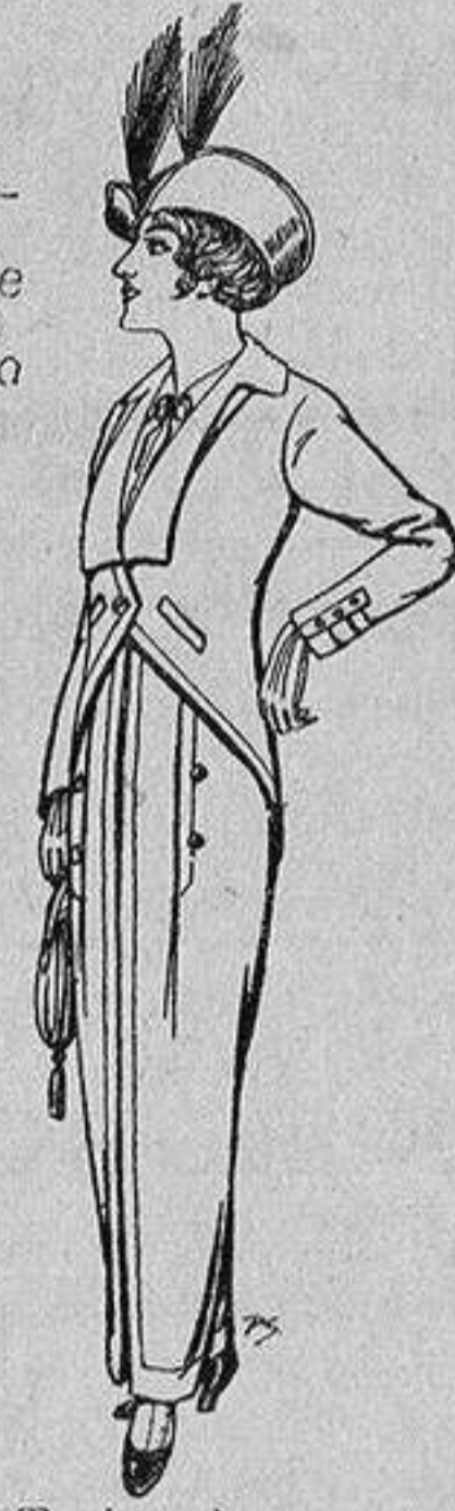
Trajes jerga negra para Señora 65 ptas.