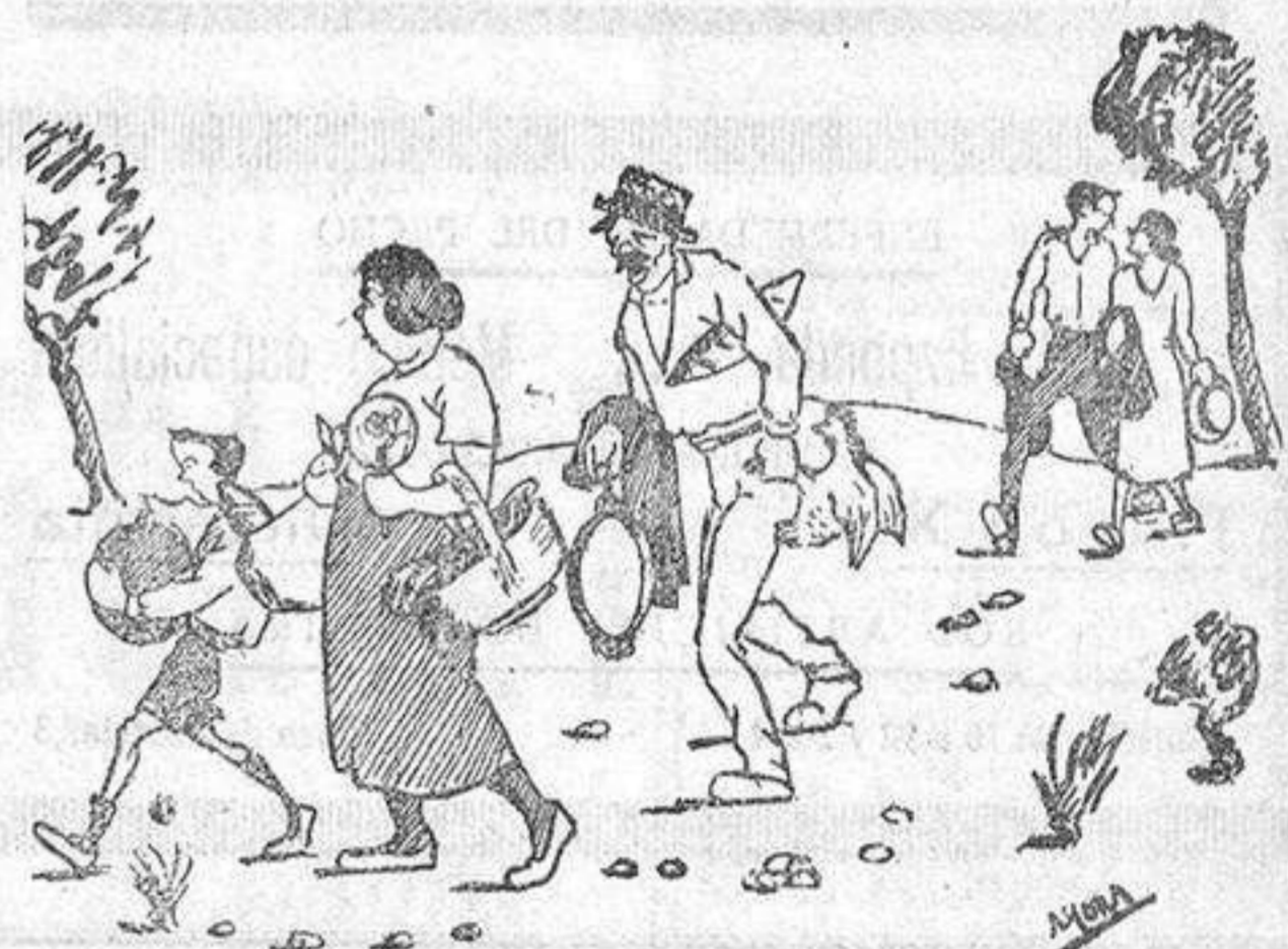
El tío Cheroni (sudoroso y aspeado) —Menos mal qu' al tornar u portarém tot dins de la panchal