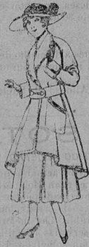
Abrigos de patén para jovencitas de 13 a 16 años De ptas. 25 a 35