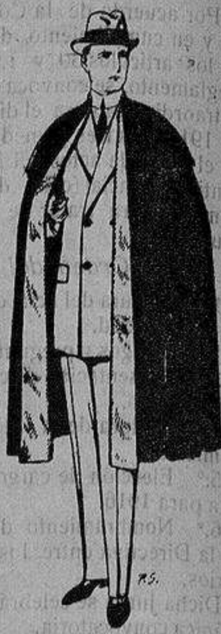
Capas (enteras) de paño De ptas. 25 a 100