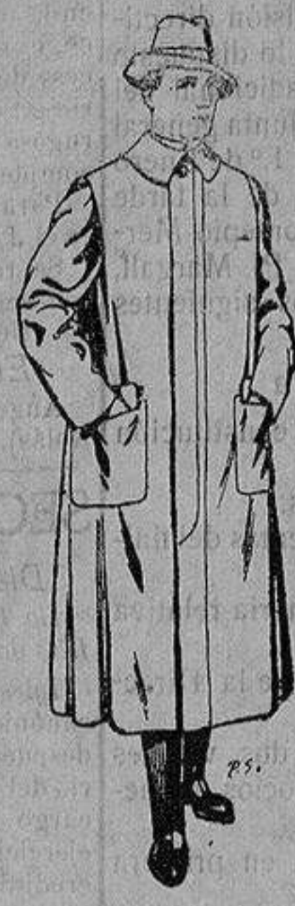
Impermeables forma gabán en color beige o gris De ptas. 35 a 100