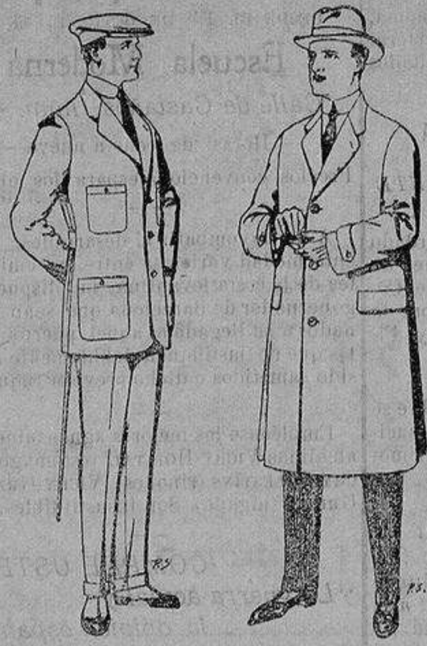
Trajes de cheviot corte elegante para "Sportman" De 35 a 50 ptas.

Peletería, Camisería, Generos de Punto, Corbatería, Guantería, Sombrerería, Zapatería, Paraguas, Bastones y Artículos de Viaje.