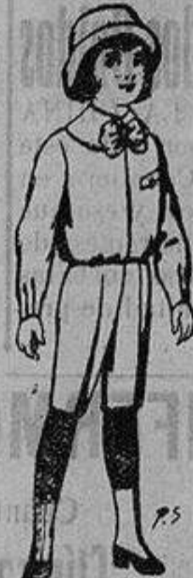
Trajes de patén para niños de 4 a 9 años De ptas. 5 a 7'50