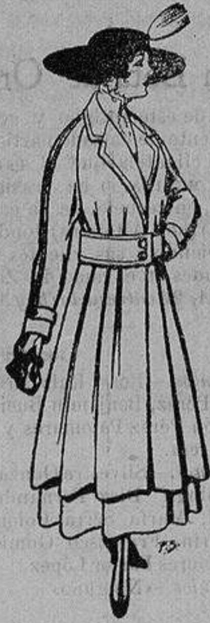
Abrigos de patén gran novedad para señora A ptas. 53