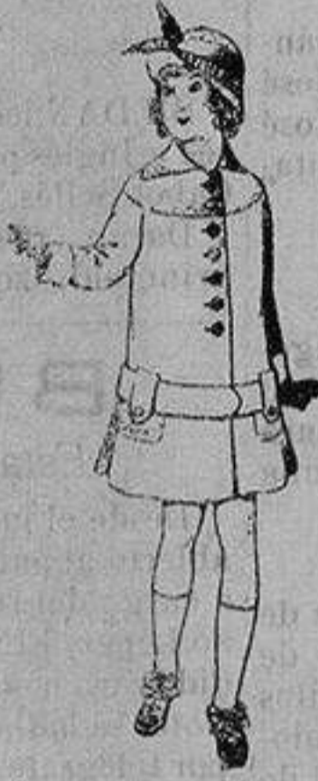
Abrigos de patén para niños de 4 a 12 años De ptas. 15 a 25