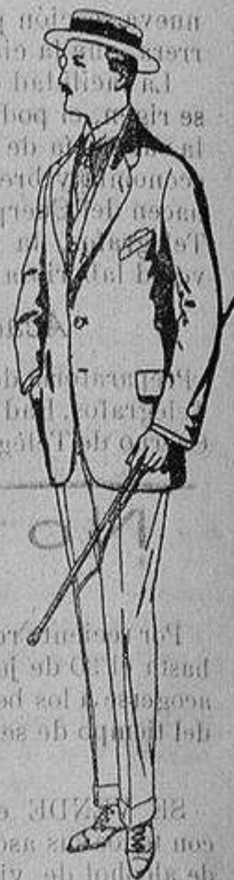
Trajes de alpaca negra De ptas. 32 a 56