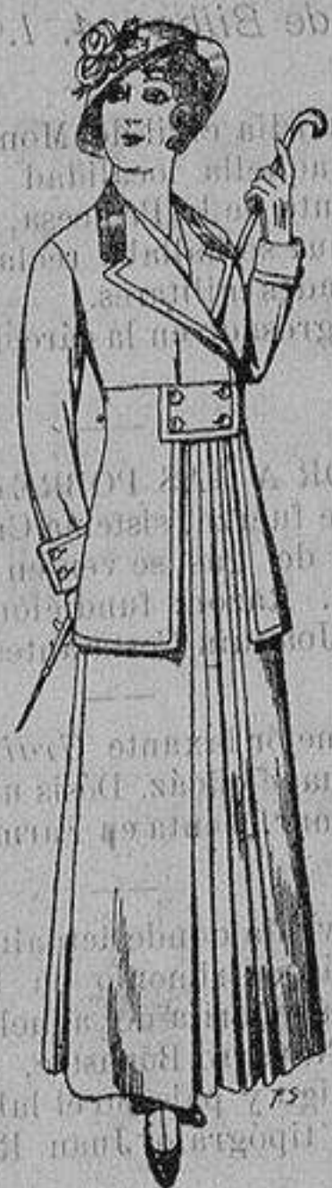
Trajes de lana ne- gra azul y color pa- ra señora A ptas. 70