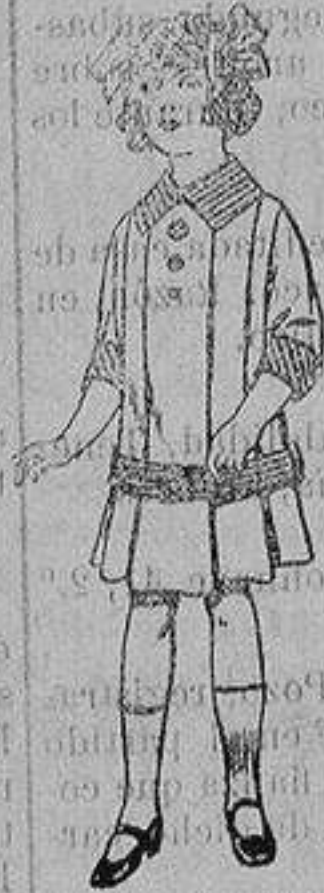
Vestidos de dril para niñas de 4 a 12 años De ptas. 5 a 12