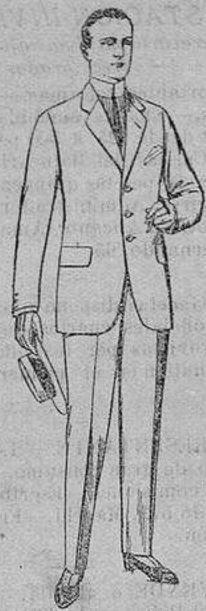
Trajes de lanilla, cheviot, etc. De ptas. 17'50 a 73

Madrid, Barcelona, Alicante, Almería, Bilbao, Cádiz, Cartagena, Gijón, Granada Málaga, Palma de Mallorca, Santander, Sevilla, Valencia, Valladolid y Zaragoza.