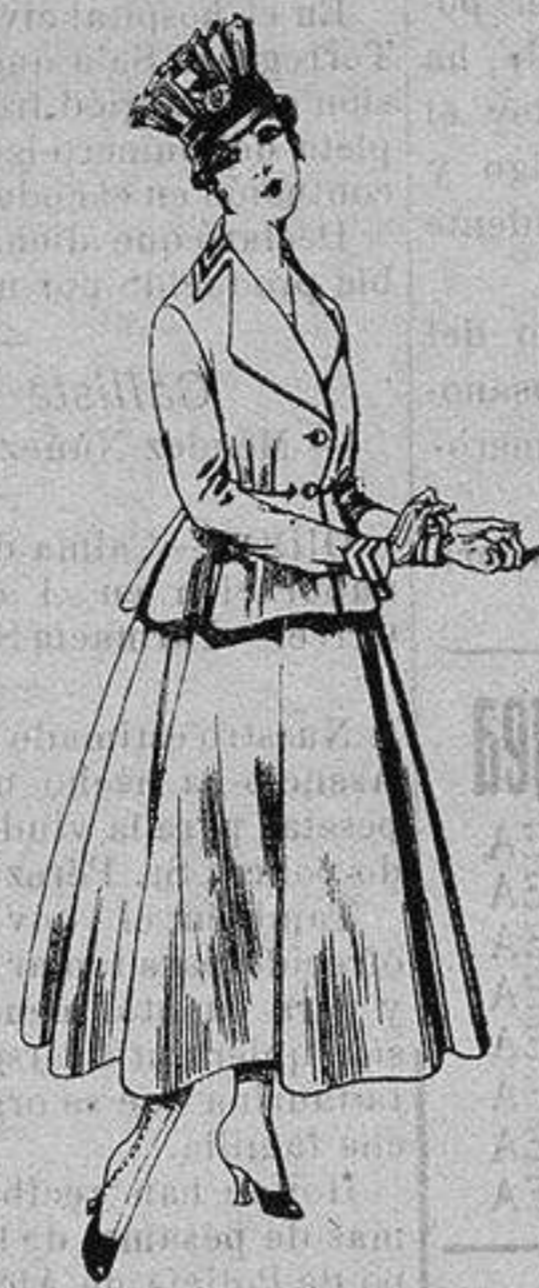
Trajes de lanilla para Señora A ptas. 80