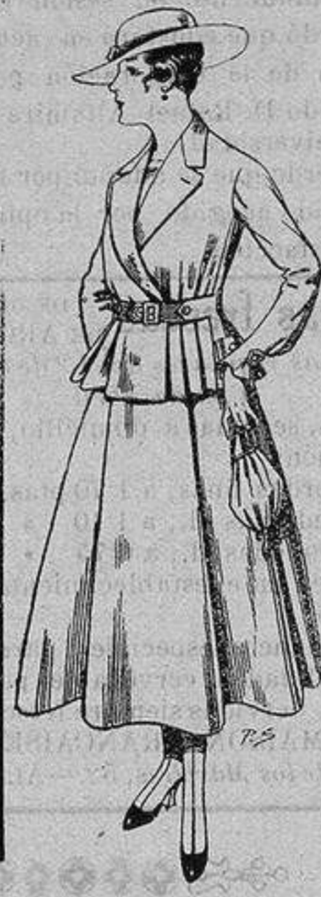
Trajes de lanilla para Señora A ptas. 70

Camisería, Géneros de Punto, Corbatería, Guantería, Sombrerería, Zapatería, Paraguas, Bastones y Artículos de Viaje.