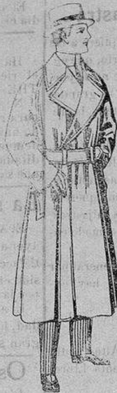
Gabanes impermeabilizados en color beige. De ptas. 65 a 110