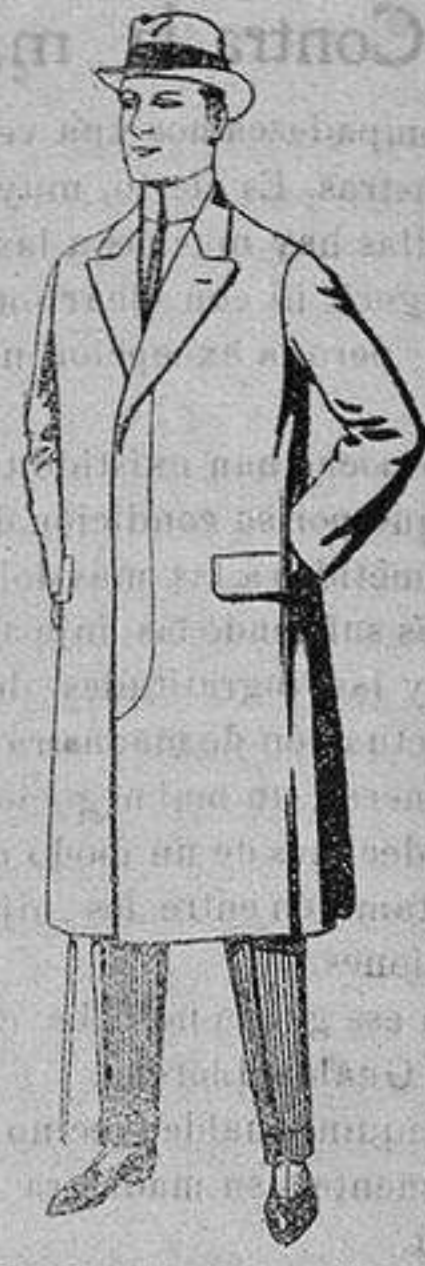
Pardessus de melton o vigonia De ptas. 25 a 100