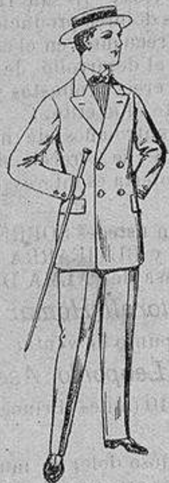
Trajes de lanilla, para jovencitos de 10 a 16 años. De ptas. 17 a 48