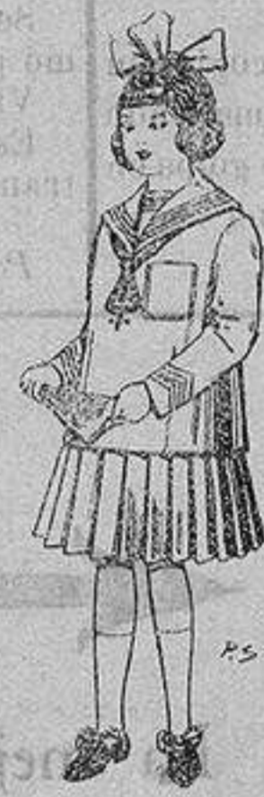
Trajes de lanilla para niñas de 4 a 12 años De ptas. 32 a 40