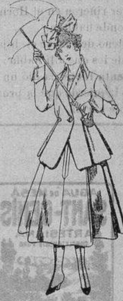
Trajes de lanilla para jovencitas de 13 a 16 años De ptas. 53 a 55