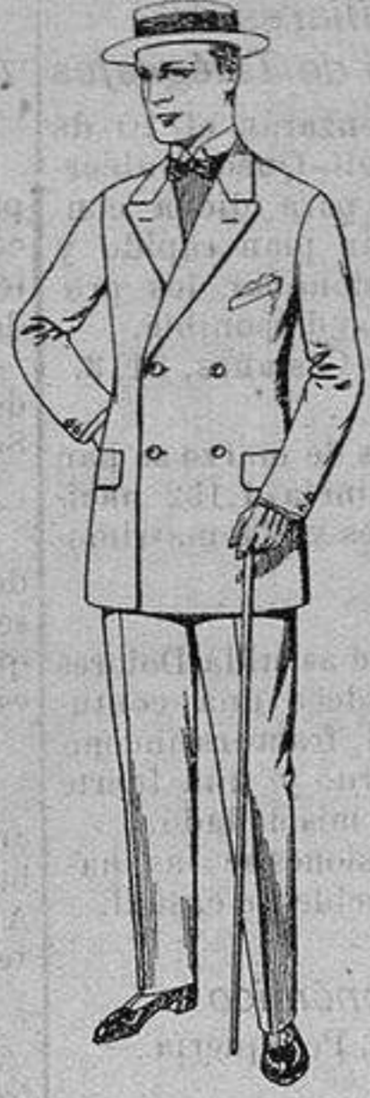
Trajes de vicuña o gerga, negros y azules De ptas. 38 a 75