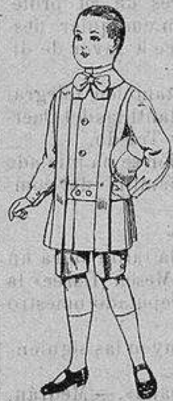
Trajes de lanilla para niños de 4 a 9 años De ptas. 12 a 31