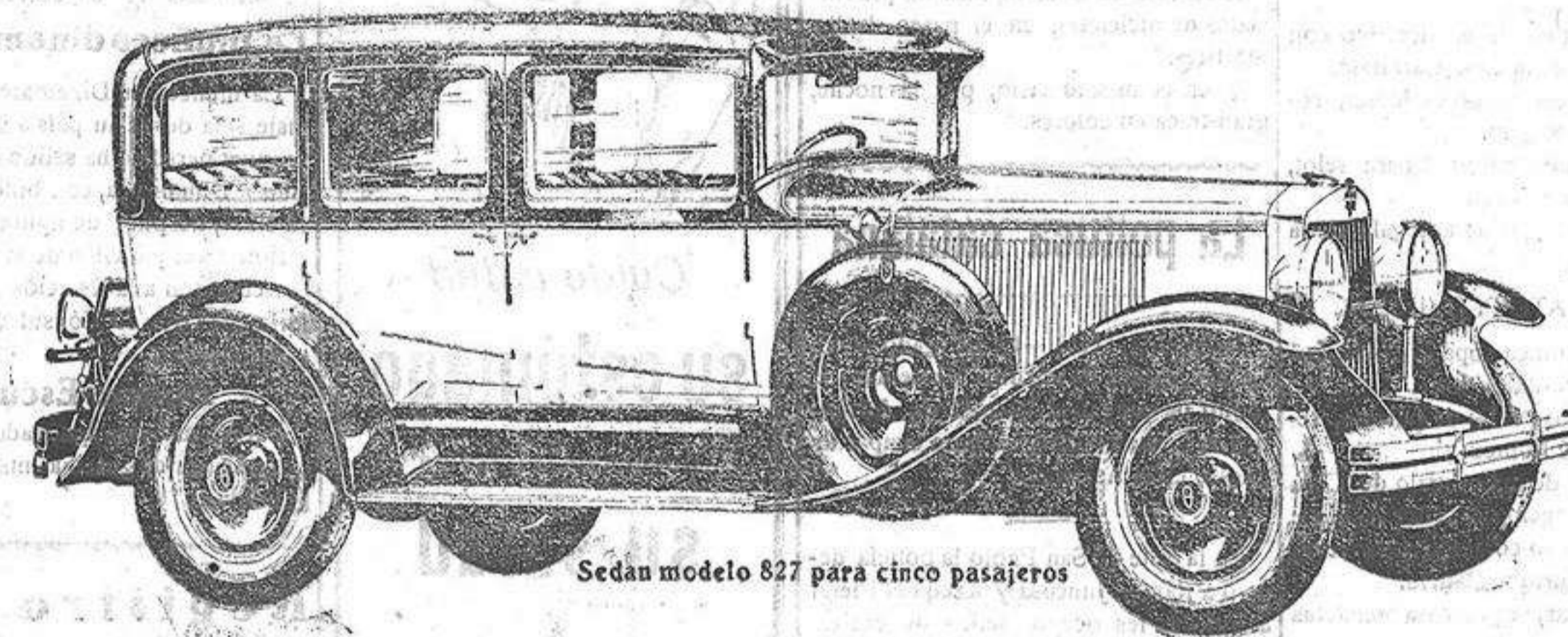
Sedan modelo 827 para cinco pasajeros

de seis y ocho cilindros con transmisión de cuatro velocidades