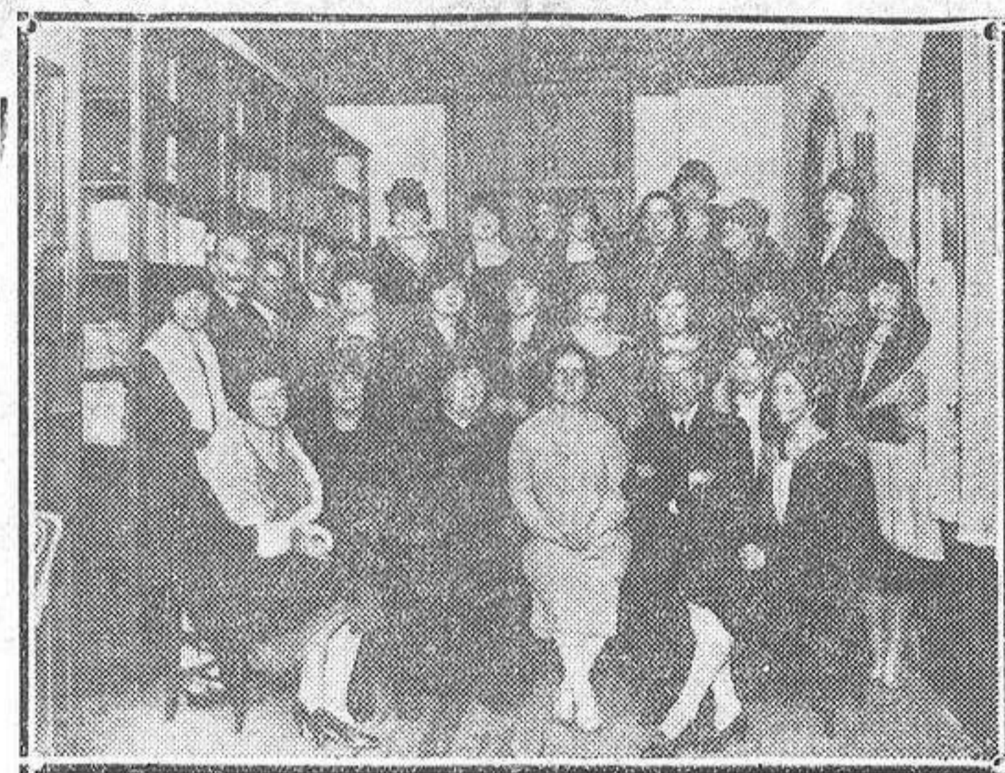
Grupo de señoras que concurrieron a la inauguración de nuevo local de la Asociación Universitaria Femenina.

en su casa en varias ocasiones en vista de la insistencia con que el García se lo pedía, y creyendo que con ella podría reintegrarse de las pérdidas que el procesado había tenido en sus negocios; dice que pagó por ella 2.000 pesetas, un carro y una caballería. Que los siete kilos de plata que se le encontraron en Madrid en casas de compra-venta con objeto de hacer moneda pero que en vista de que no pudo hacerle, los empeñó en Orihuela.