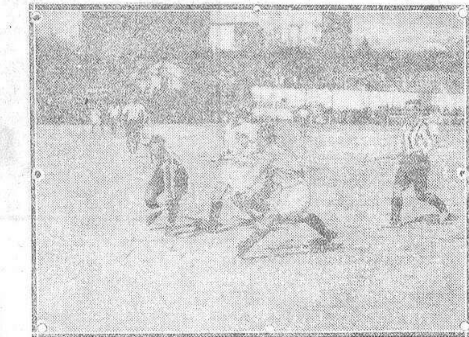
Un detalle del encuentro de hockey Fesrolia i-Athletic, correspondiente al campeonato del Centro.

Empieza el partido con grandes ataques de los locales, que juegan con inmenso entusiasmo, distinguiéndose en estos momentos de verdadero agobio, para los alaveses, la labor reali-