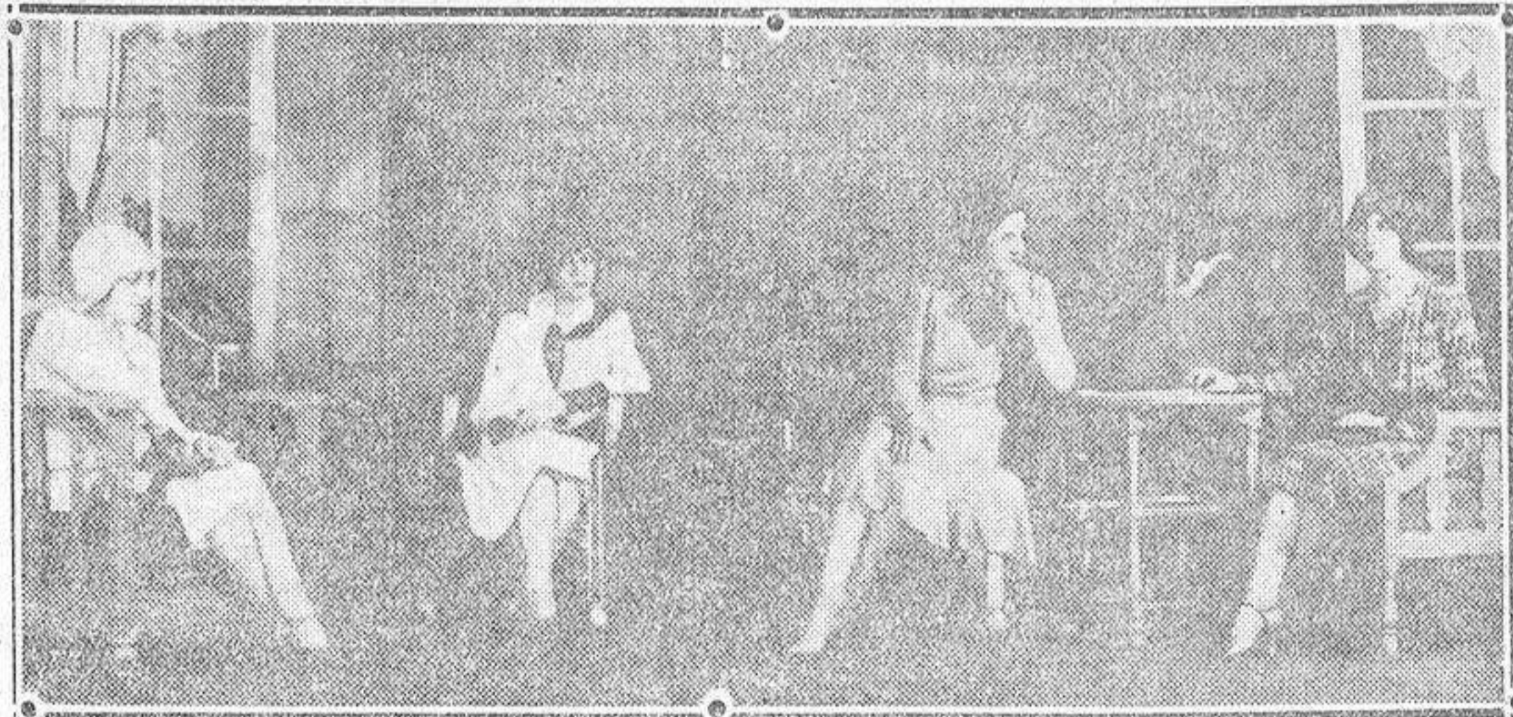
Una escena de la comedia «Hijos de araña», estrenada con gran éxito en el aristocrático Teatro Lara