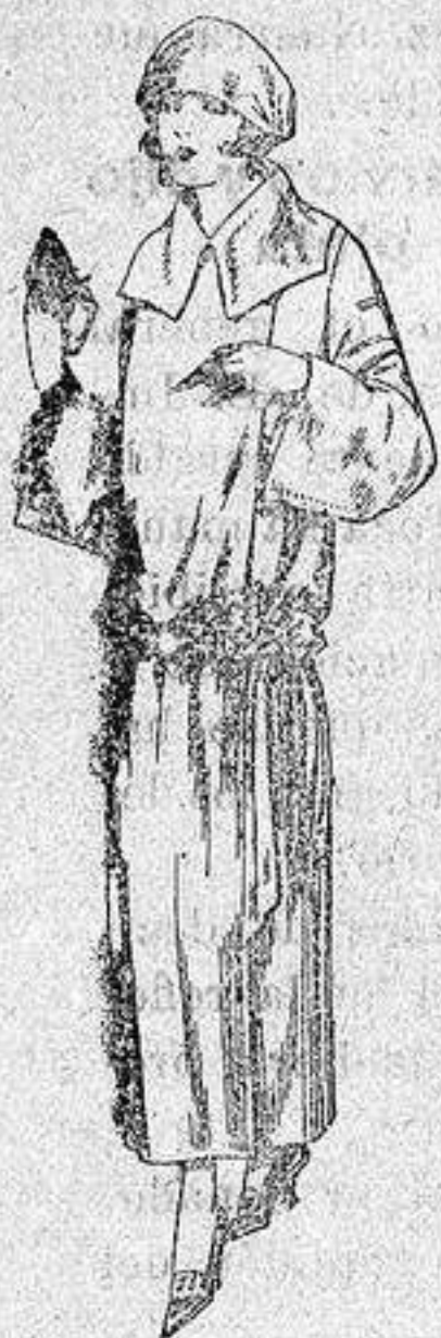
Guardapolvos de dril crudo, gris, b.ig, etc. de ptas. 18 a 25.