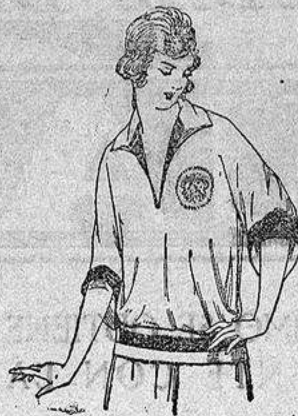
Blusas tricót de seda en negro y colores moda. a ptas. 39