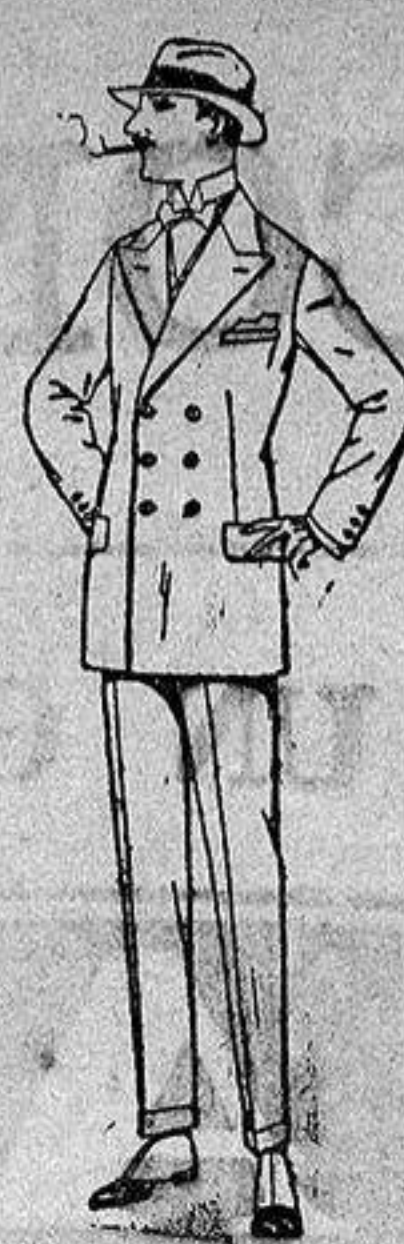
Trajes de lanilla, melton estambre vicuña o jerga. de ptas. 40 a 140.