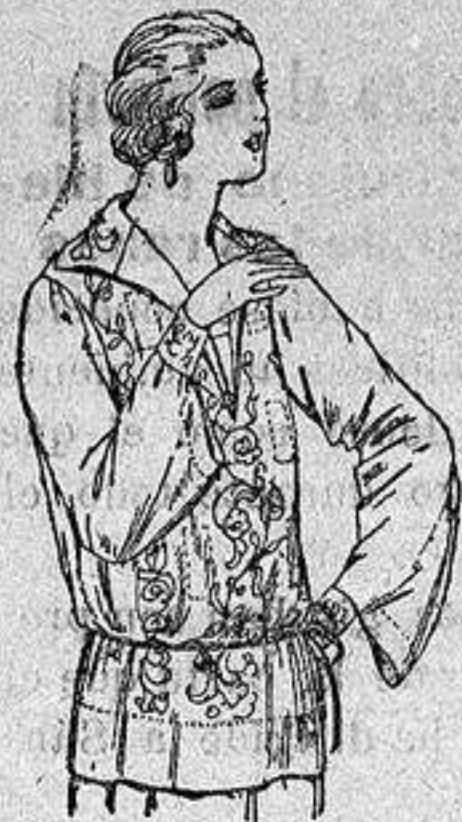
Brusas de voile de seda en negro y blanco adornos bordados. a ptas. 22.