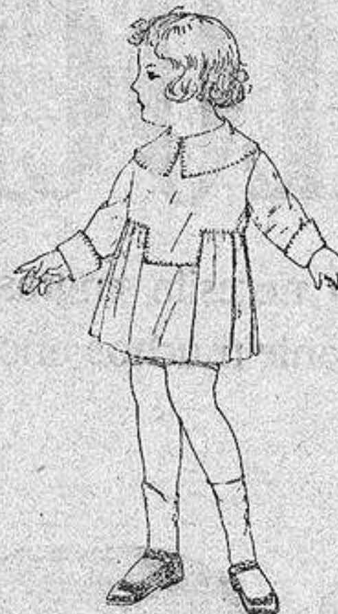
Vestidos batista blanca pespuntes no para niñas de edad de 3 a 6 años. de 5 50 a 6 50. ptas.

Ropas confeccionadas para Caballero, Señora Niño y Niña