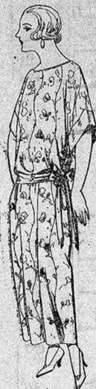
Batas de crespón, en negro y colores, adornos bordados. de ptas. 32 a 33