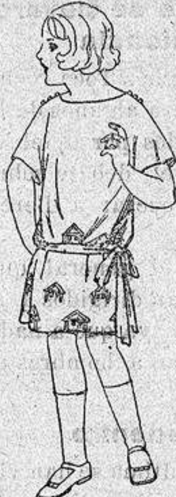
Vestidos popelina sarga inglesa etc. adornos bordados para niños de 4 a 9 años. de ptas 30 a 35.

Ropas confeccionadas para Caballero, Señora Niño y Niña