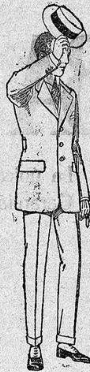
Trajes modelo Spotr, de lanilla; melton etc. de ptas 75 a 10