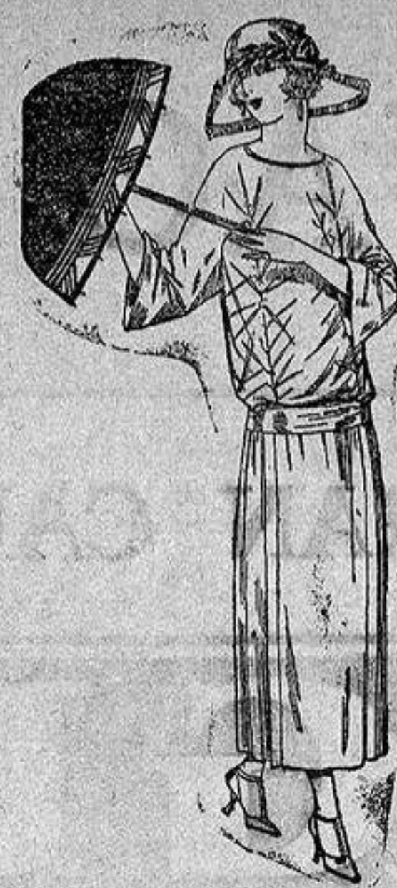
Vestidos de tricót de seda, en negro, azul y colores moda adornos bordados. a ptas. 115