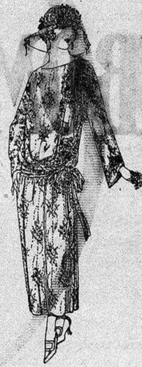
Vestidos de velo de algodón, dibujos novedad. a ptas. 50

Boas, Camisería, Géneros de punto Corbatería Guantería, Sombrería Zapatería, Paraguas, Bastones Sombrillas y Artículos de viaje