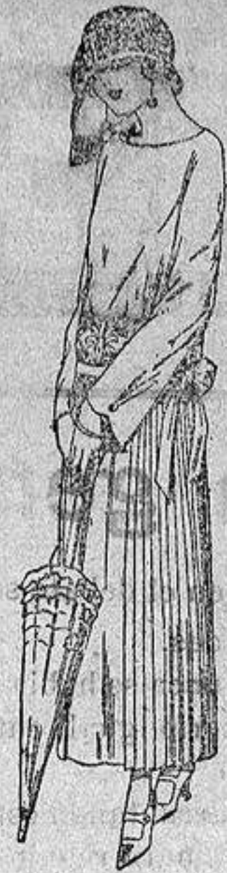
Vestidos de sarga inglesa, popeline, etc. en negro, azul y color, adornos bordados a mano. a ptas. 110