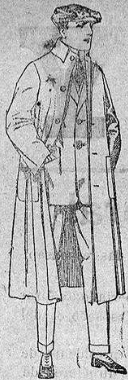
Guardapolvos de dril, igual al modelo. de ptas. 12 a 20.

Altamira, 2 :- Alicante :- Victoria, 1 Sucursales: Madrid, Barcelona, Almeria, Bilbao, Cadiz, Cartagena, Gijón, Granada, Málaga, Palma de Mallorca, Santander, Sevilla, Valencia, Valladolid, Zaragoza