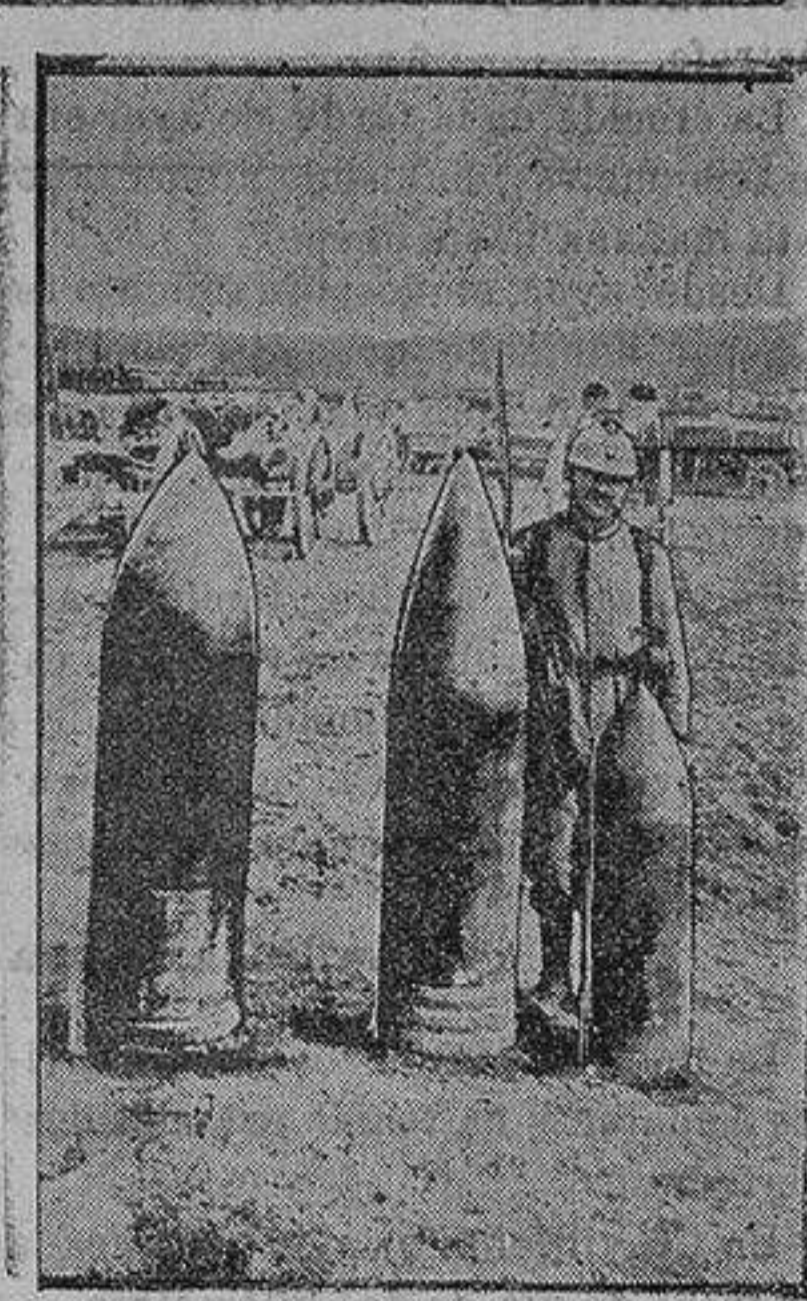
Proyectiles de grueso calibre del ejército francés.

Dirigirse a «El 66» Saldos.—Altamira, 9.