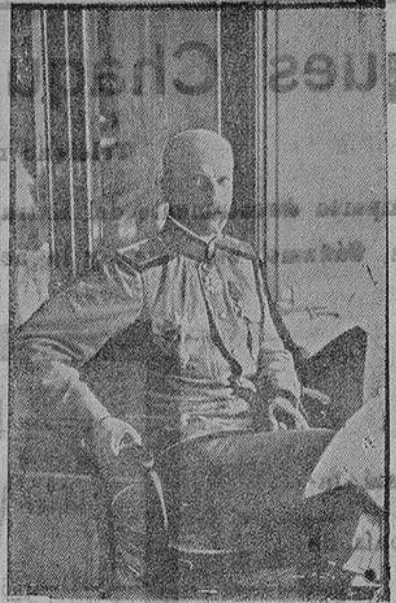
El general Lohwitsky