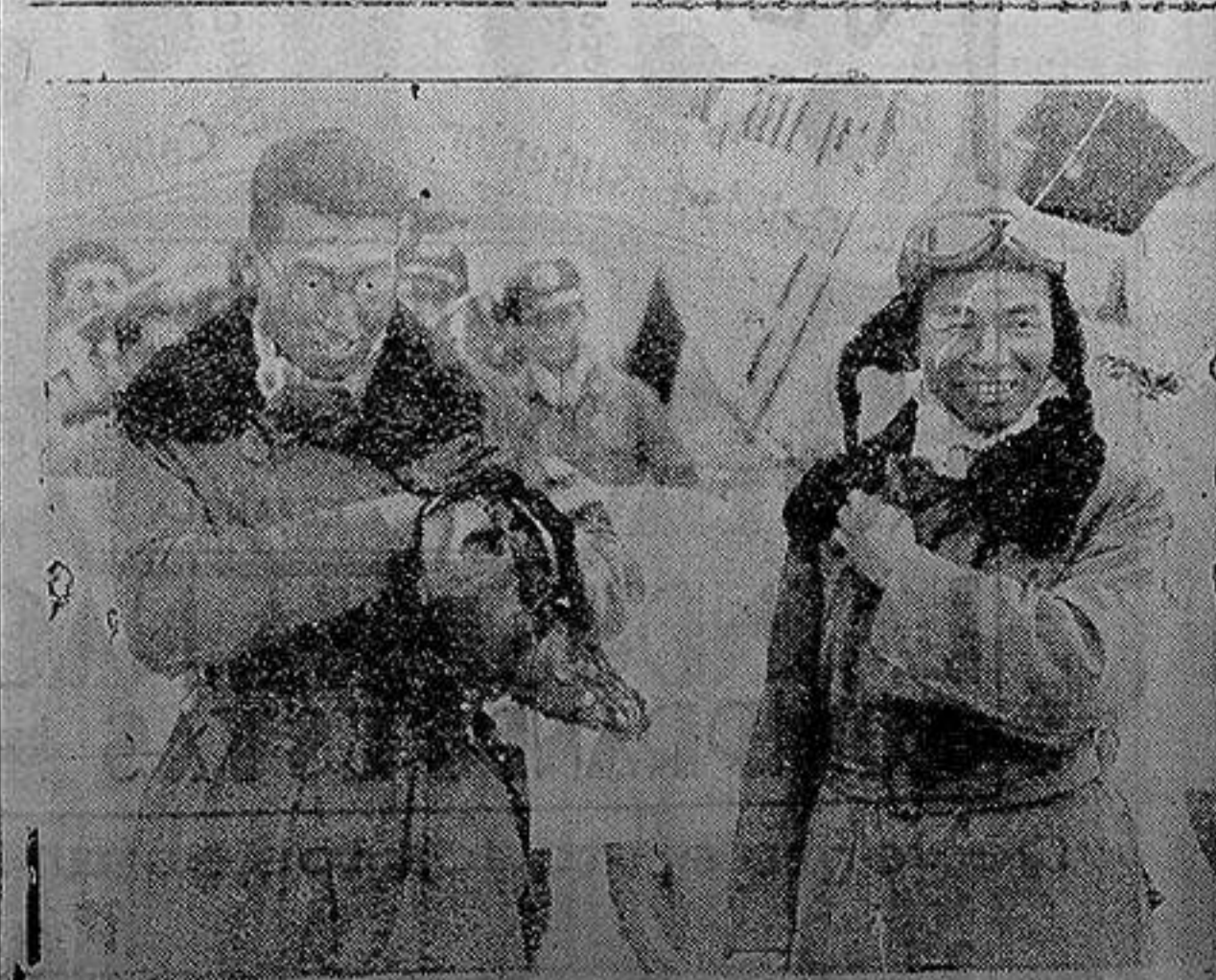
París.—Los dos aviadores japoneses que han llegado a París viniendo desde su país pilotando un aeroplano de turismo