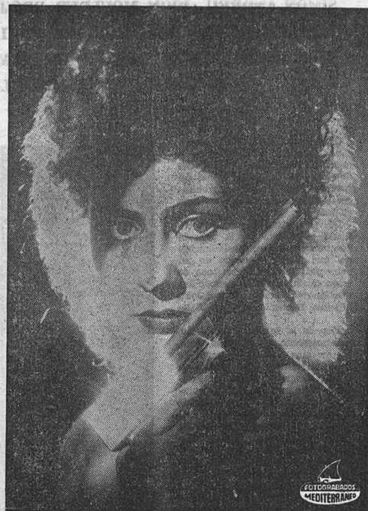
LULU: nueva imagen y nuevo éxito.

La vitalidad de Lulu, su vivacidad, su exuberante entrega natural de hoy en día, alcanzaron su máxima expresión en una época agitada, no por su violento pleno cambio, sino por una fuerza superpotente.