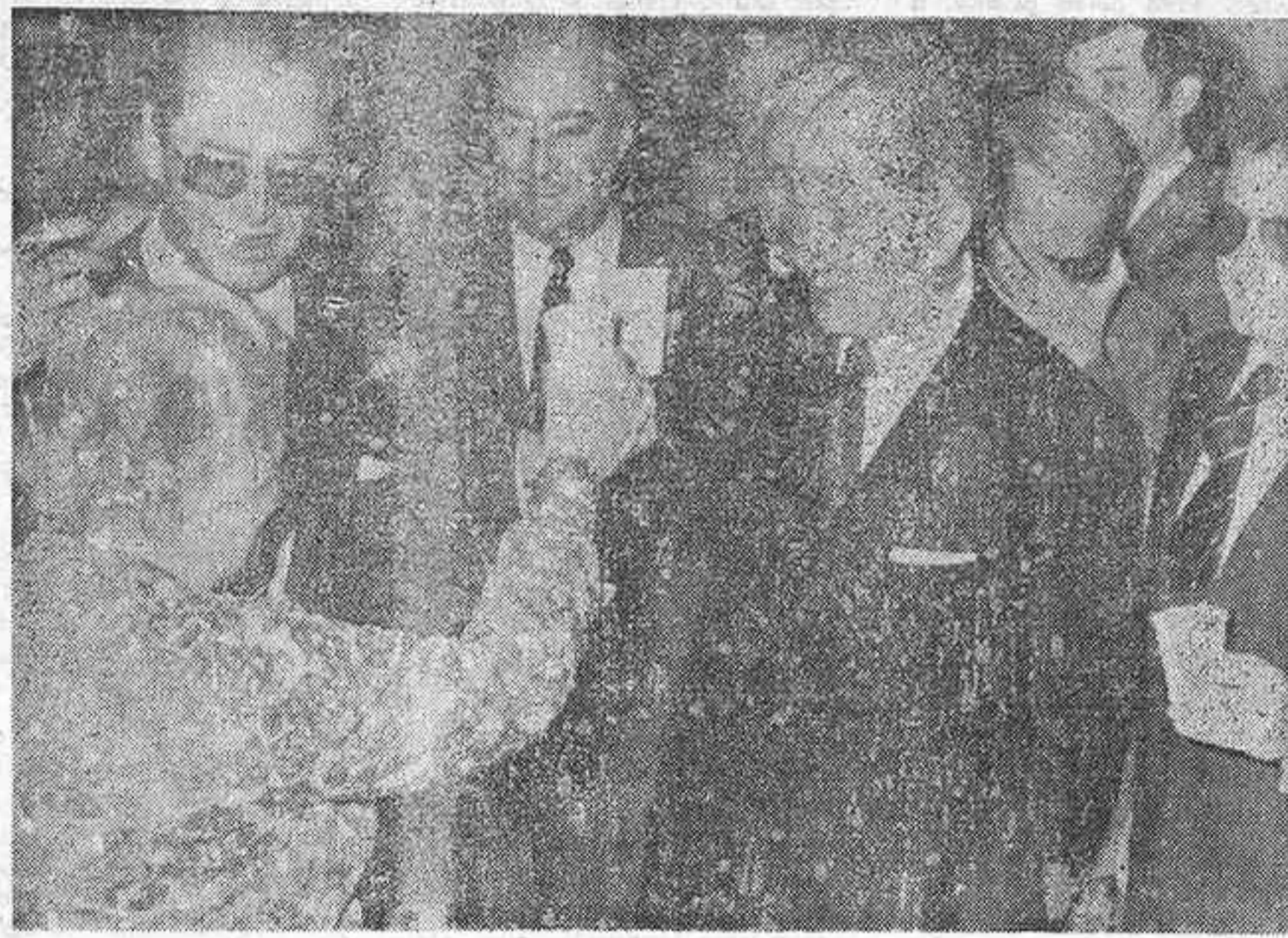
MADRID. — El vicepresidente tercero y ministro de Trabajo, don Licinio de la Fuente, brindando por el nuevo año con los pensionistas del Hogar del Puente de Vallecas, con los que compartió las últimas horas del año cuando asistían a una fiesta especial.