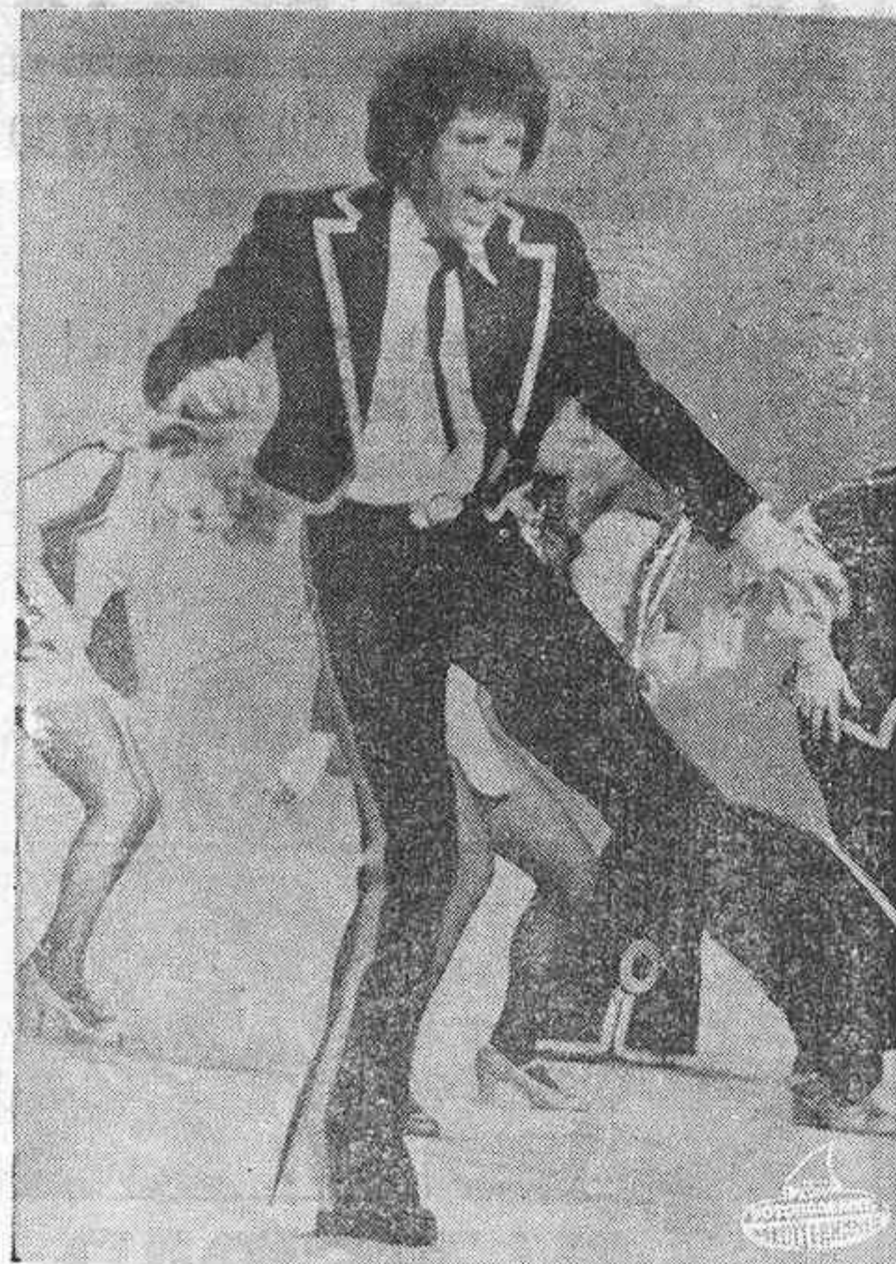
TOM JONES durante su actuación en el programa Fin de Año de T. V. E.