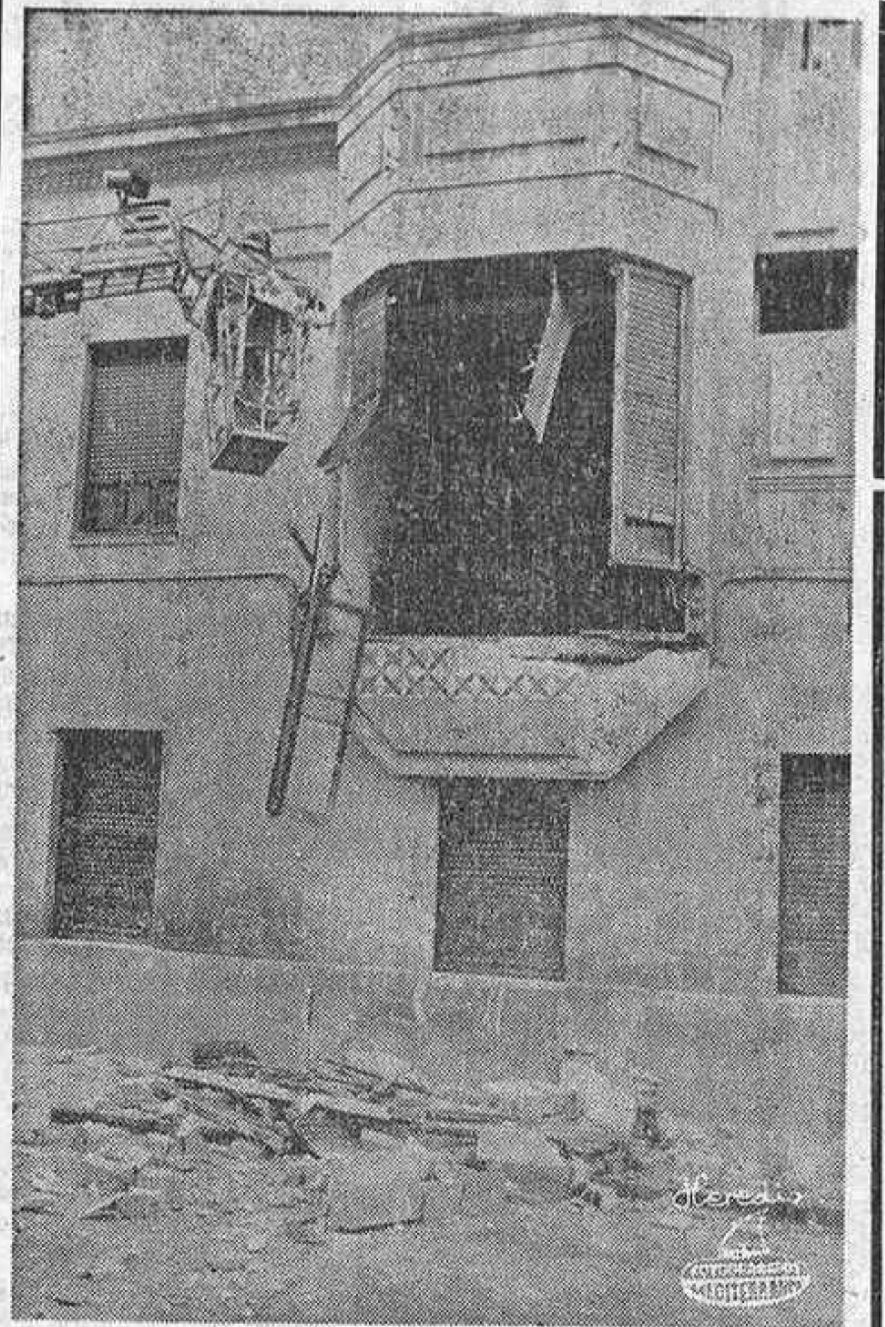
Ante el aspecto alarmantemente ruinoso que presentaba el mirador de la casa número 7, en la calle Antonio Pons, ayer en torno al mediodía los Bomberos procedieron a su demolición. momento que recoge la fotografía de Heredia.