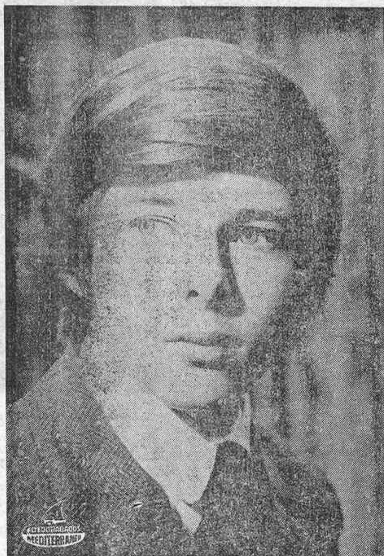
John Moulder Brown, convertido en activo protagonista del cine español.

Eloy de la Iglesia ha cubierto, prácticamente en solitario, dentro del cine español, el papel de «niño terrible» con sus relatos de terror, sangre y violencia. Películas suyas son —si ustedes quieren recordarlas— «El techo de cristal», «Nadie oyó gritar», «La semana del asesino», «Una gota de sangre para morir amando»... Y las dos primeras que casi nadie les cita a la hora de hacer recuento, «Algo amargo en la boca» y «Cuadrilátero».