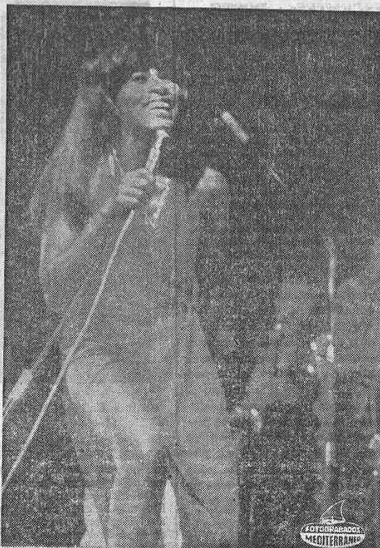
TINA TURNER, en pleno apogeo interpretativo.

Ike and Tina Turner, es una de las parejas más importantes dentro del actual panorama musical norteamericano, cuyas canciones y discos tienen grandes adeptos en todo el mundo. Se publica en estos días en España, un LP que, bajo el título genérico de «Sweet Rhode Island