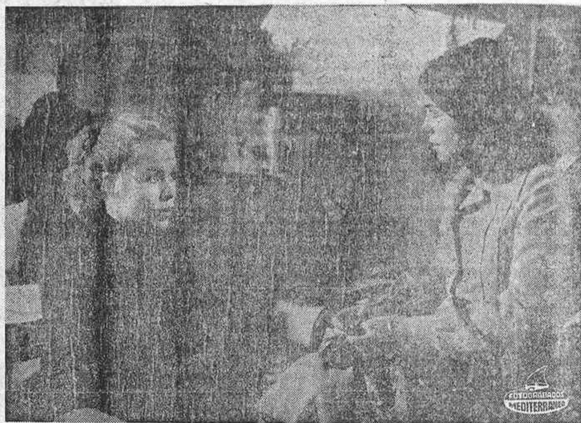
Cristina Galbó y Maribel Martín en la versión cinematográfica «Olvida los tambores», dirigida por Rafael Gil.

Julián Mateos, Cristina Galbó, Tony Isbert y Maribel Martín, entre los protagonistas