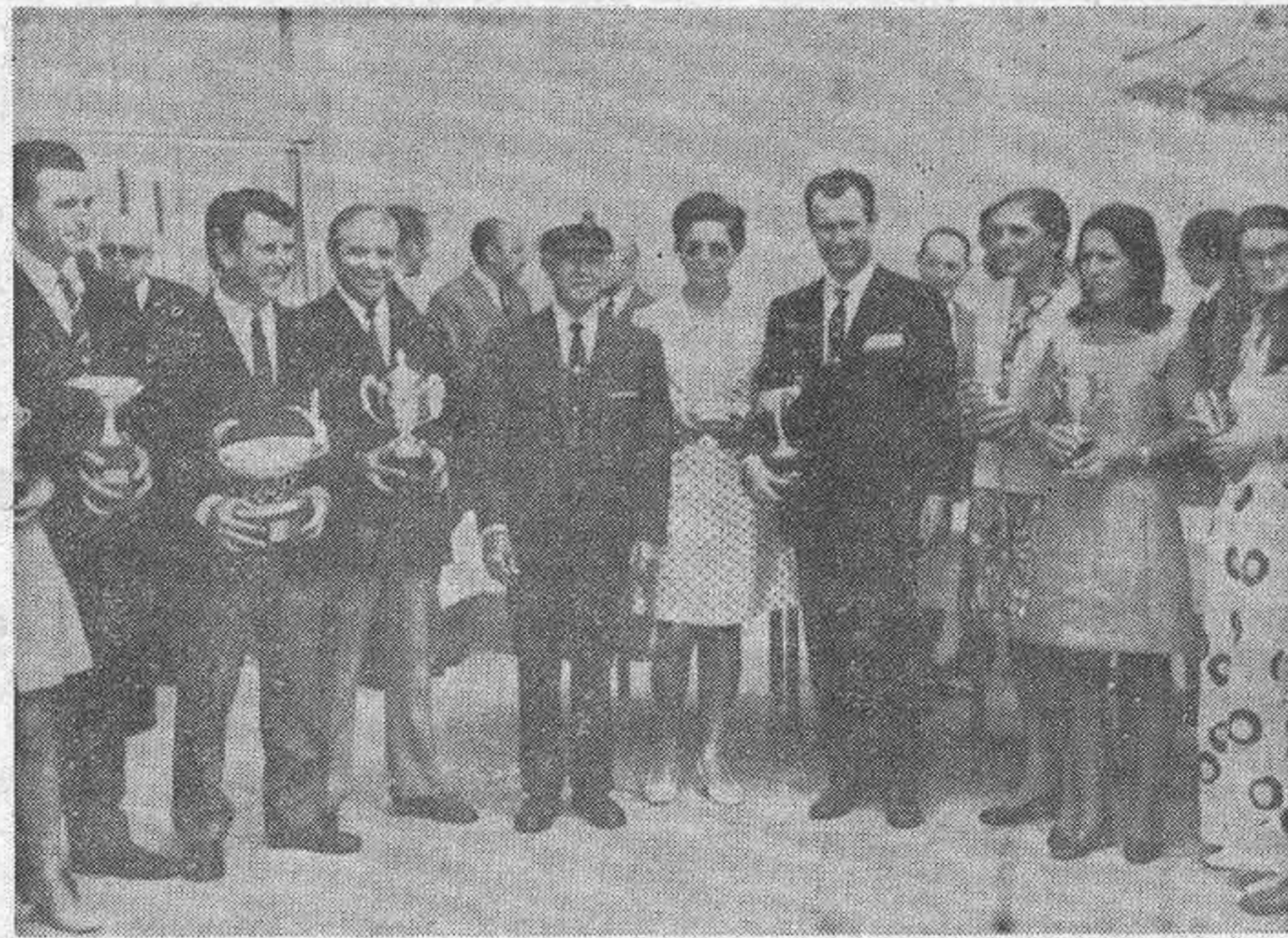
En La Coruña se ha celebrado el torneo de golf de la "Zapateira", al que han concurrido los más acreditados jugadores de esta especialidad deportiva. Terminado el torneo se celebró el acto de reparto de premios que fue presidido por S.E. el Generalísimo Franco, quien hizo entrega a los vencedores de los trofeos conquistados. En la foto vemos al grupo de participantes que obtuvieron galardones, acompañando al Caudillo.