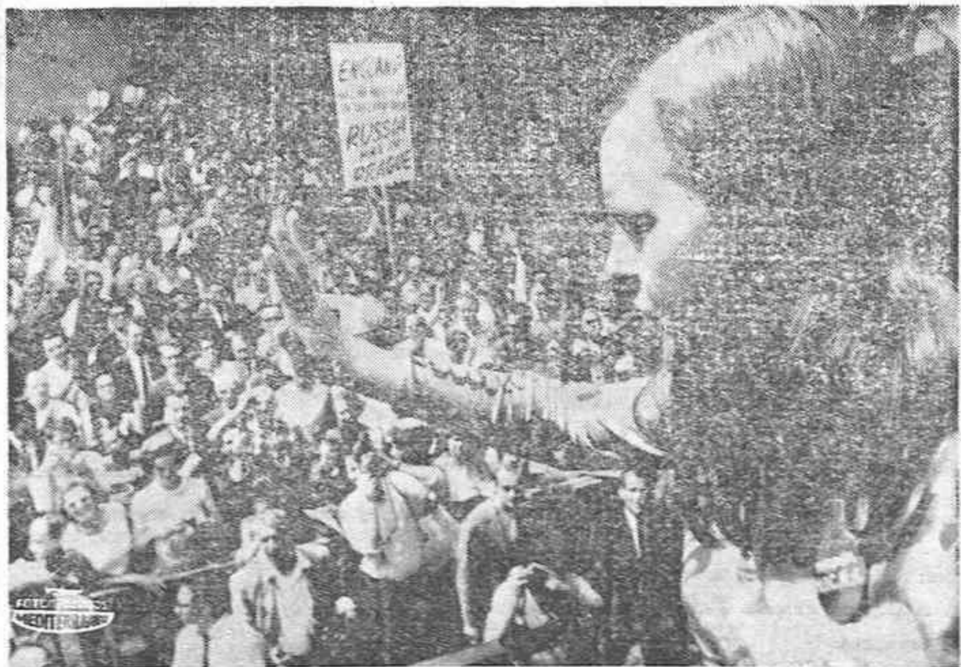
NEVA GRK. — La representante del Ulster en el Parlamento británico, Bernadette Devlin, de 22 años, se dirige a la multitud que marcha por las calles desde las Naciones Unidas, en demanda de "derechos humanos en Irlanda del Norte". Bernadette dijo a la multitud que "el Primer Ministro Harold Wilson debería reprimir su orgullo político y solicitar ayuda de las Naciones Unidas".