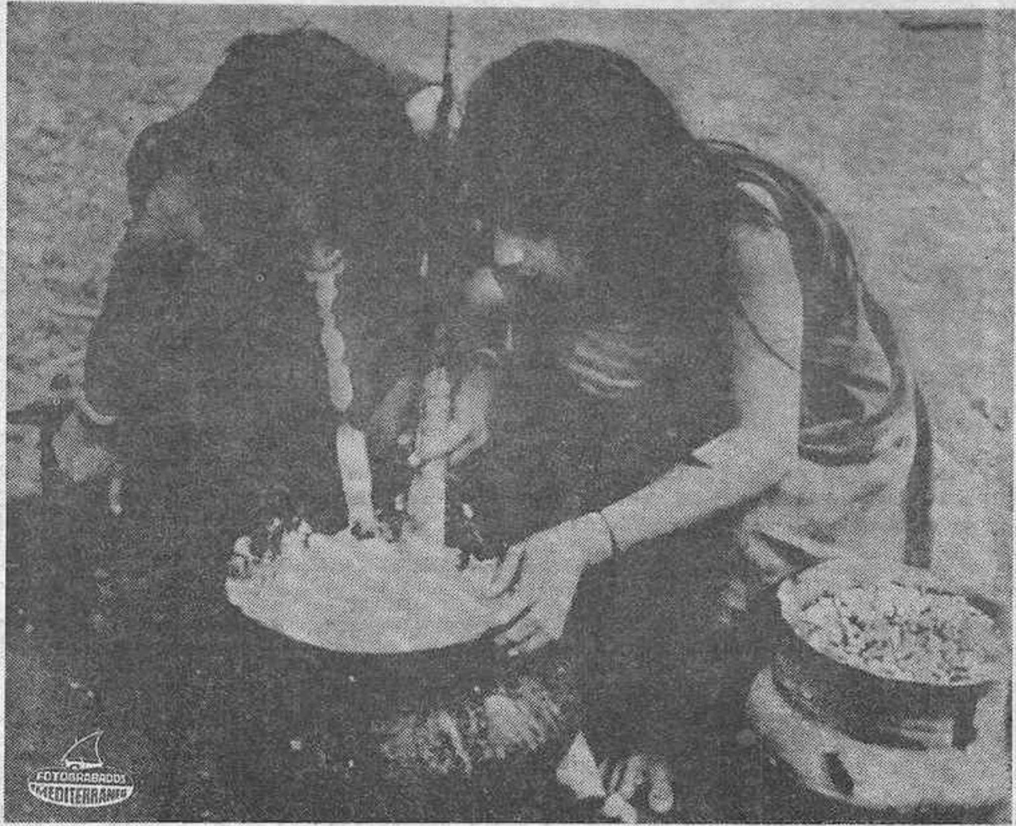
¿Quiénes son estos hombres que se han hecho famosos como "reducidores de cabezas"?

Un atlético guerrero caminó hasta el centro del corro, clavó su lanza en la tierra y en su extremo libre, ensartó —sacándole de una especie de zurrón que le colgaba a un costado— una diminuta y ennegrecida cabeza humana, cuya cabellera comenzó a flamear al viento.