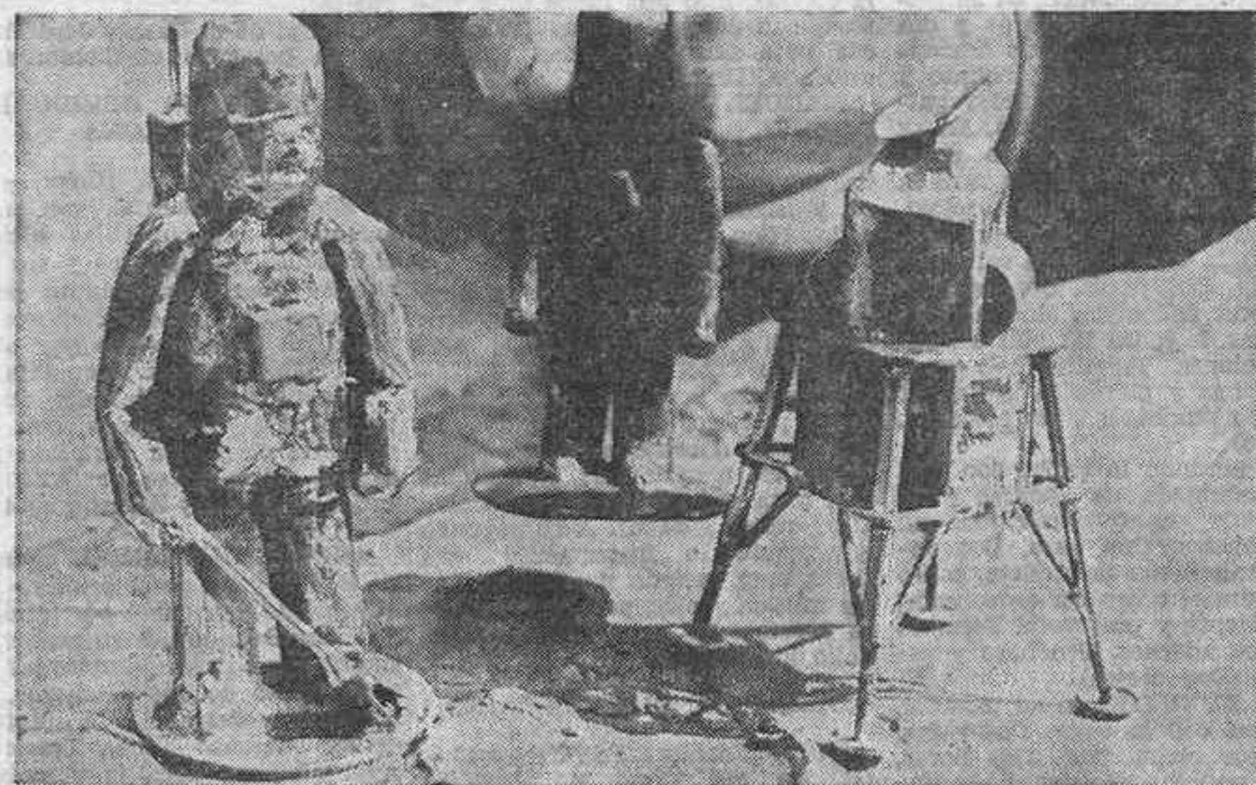
FRANKFORT.—Las piezas del ajedrez como astronautas es la creación de un artesano de Oberammergau, y que se muestran en la Feria de Frankfort que abrió anteaer sus puertas. El astronauta de la izquierda es el áfil, el del centro un peón, y el módulo de aterrizaje lunar representa al rey