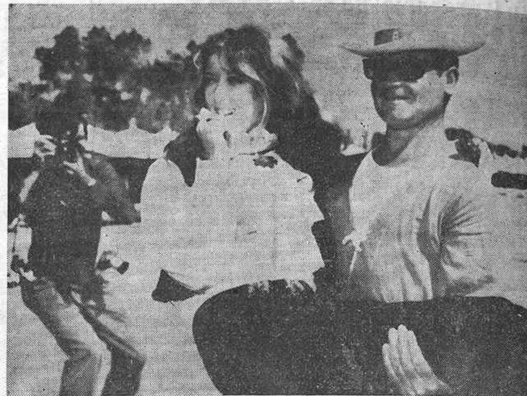
VENEZIA. — El Festival de Cine está en marcha y con tal motivo es frecuente la llegada de las estrellas de cine, que aprovechan tan magnífico escaparate para hacer sus genialidades y sacar partido de la presencia de tanto fotógrafo de prensa. En la fotografía, la actriz israelí, protagonista de la película "Woman's Case" (El caso de la mujer) ha optado por esta postura en su presentación en Venecia