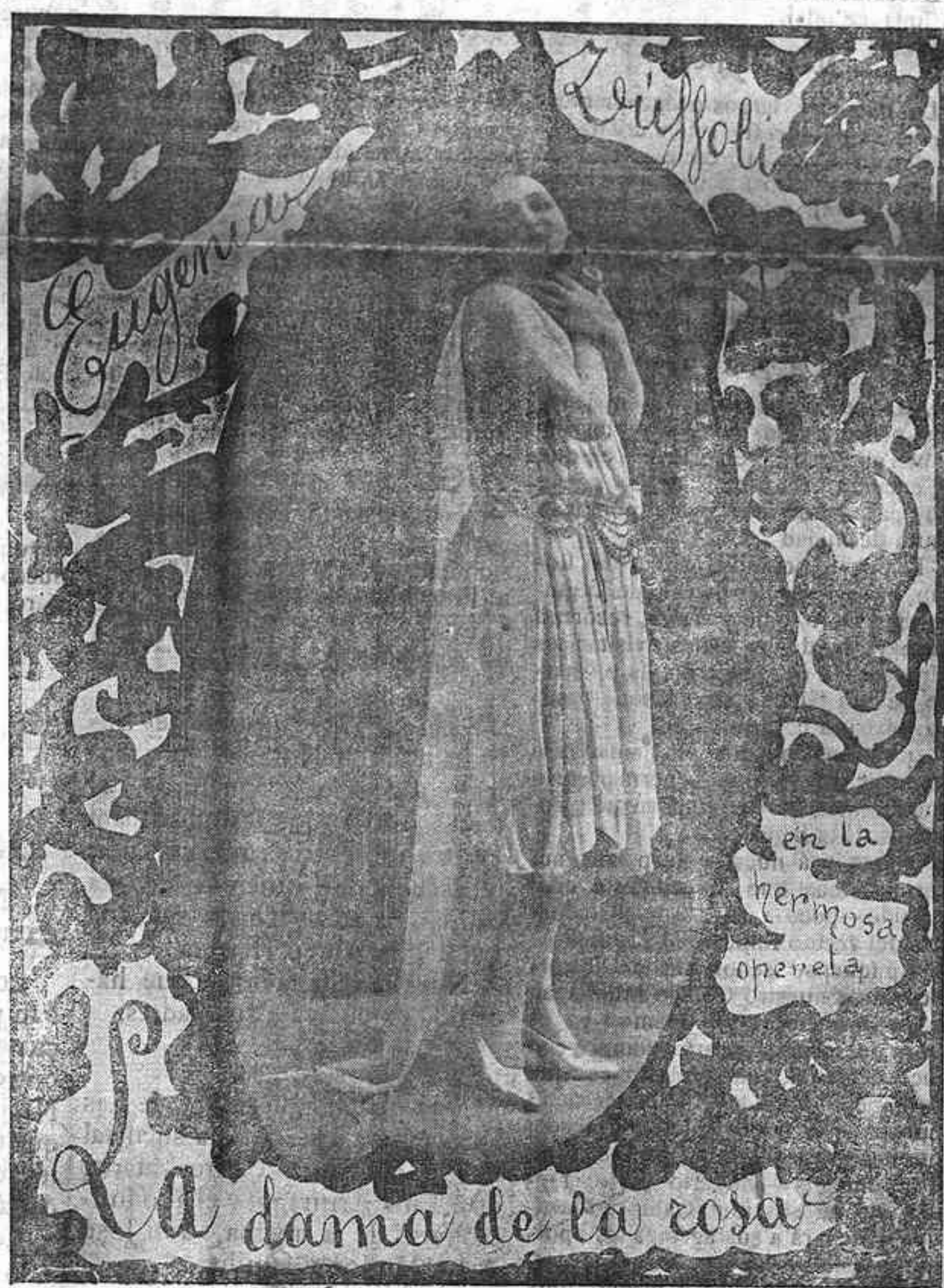
La dama de la rosa