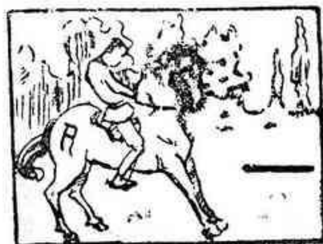
La solución, mañana.