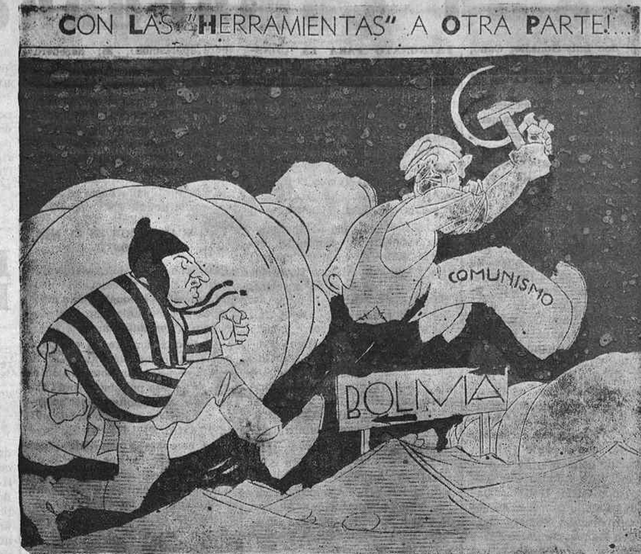
EL GENERAL TORO.-- ¡Váyase a "trabajar"... donde le llamen! Aquí nadie lo necesita ¿entiende?

Este abuelo mío defendió la legalidad en el orden constitucional de aquella época. Cumplió con su deber. Pero si viviera hoy ese abuelo mío, sería lo que el gobierno de Madrid llama impropiamente: "un rebelde". Y no es justa ni adecuada tal denominación, por el sencillo motivo de que nosotros no