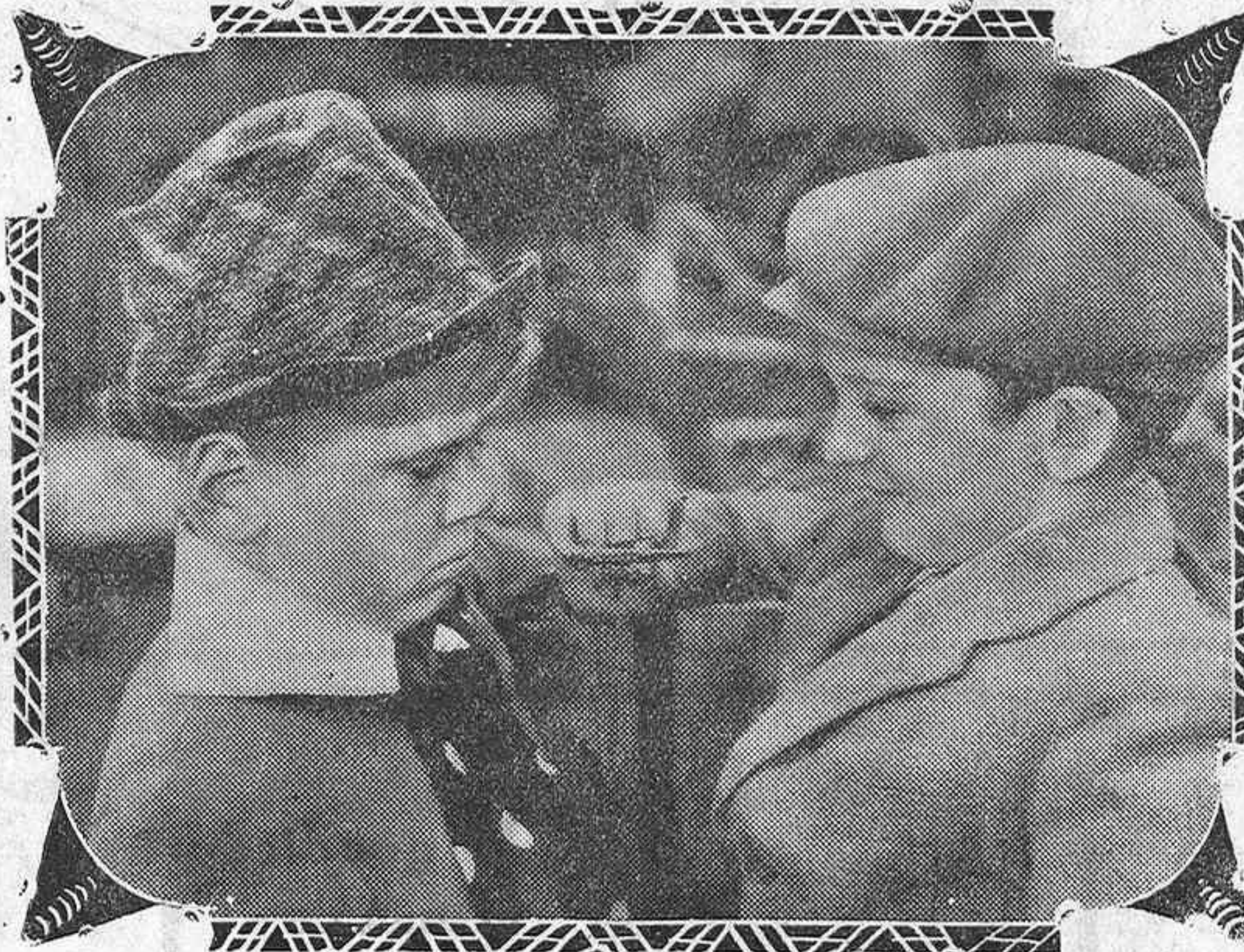
UNA INTERESANTE ESCENA DE LA PELICULA INFANTIL "LAS PERIPECIAS DE AKIPPY"

ga". Y le agradaría más todavía saber que ha gustado al público esta interpretación suya de lo que se describe como un romance encantador de período napoleónico; pero le contraría muchísimo que una docena o un centenar o un millar de personas se aglomere en torno suyo en la calle para expresarle su admiración.