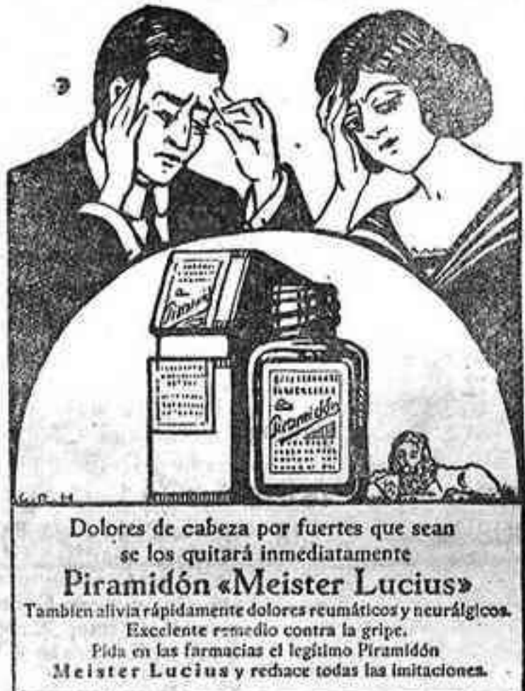
Dolores de cabeza por fuertes que sean se los quitará inmediatamente Piramidón «Meister Lucius» También alivia rápidamente dolores reumáticos y neurálgicos. Excelente remedio contra la gripe. Pida en las farmacias el legítimo Piramidón Meister Lucius y reduce todas las molestias.

Gran rebaja de precios para cok y alquitran Cok de Gas, quintal en fábrica Pesetas 5'00 Cok de Gas, quintal en fábrica Pesetas 5'50 Cok de Gas, quintal en fábrica Pesetas 100'00 Precios especiales para pedidos importantes El cok que ofrecemos es de primera calidad, el mejor sustituto para el carbón vegetal, carbón mineral empleado en cocinas, hornos de planchar y la antracita para motores de gas pobre. Propio para fundiciones. Alquitran kilo suelto Pesetas 0'50 Alquitran kilo suelto Pesetas 100'00 El alquitran es el mejor sustituto de pintura para embarcaciones marítimas, aislante para maderas o hierros empotrados o expuestos a la intemperie, asfaltado de calles y aceras. Precios especiales para mayores pedidos Se solicitan revendedores en las poblaciones de Tenerife y en las demás islas.