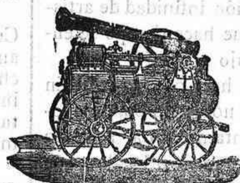
Máquina de vapor locomovil