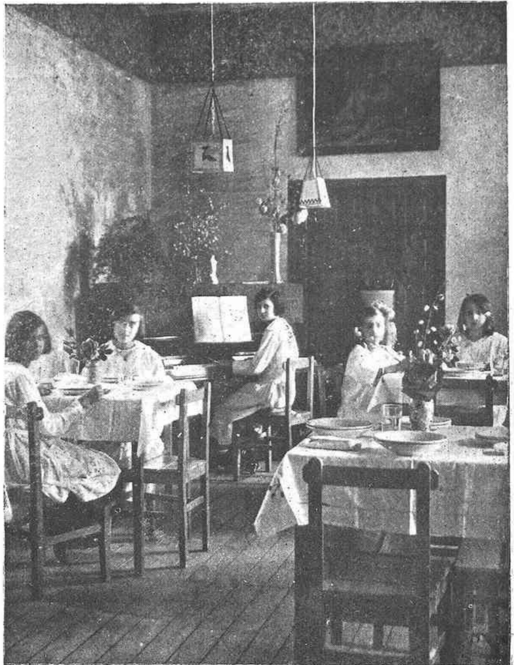
Sala - Comedor

Las alumnas deberán conocer y aceptar este Reglamento antes de quedar definitivamente en la casa. (Para cuantas consultas se deseen, diríjase a la Plaza de la Concha, 17)