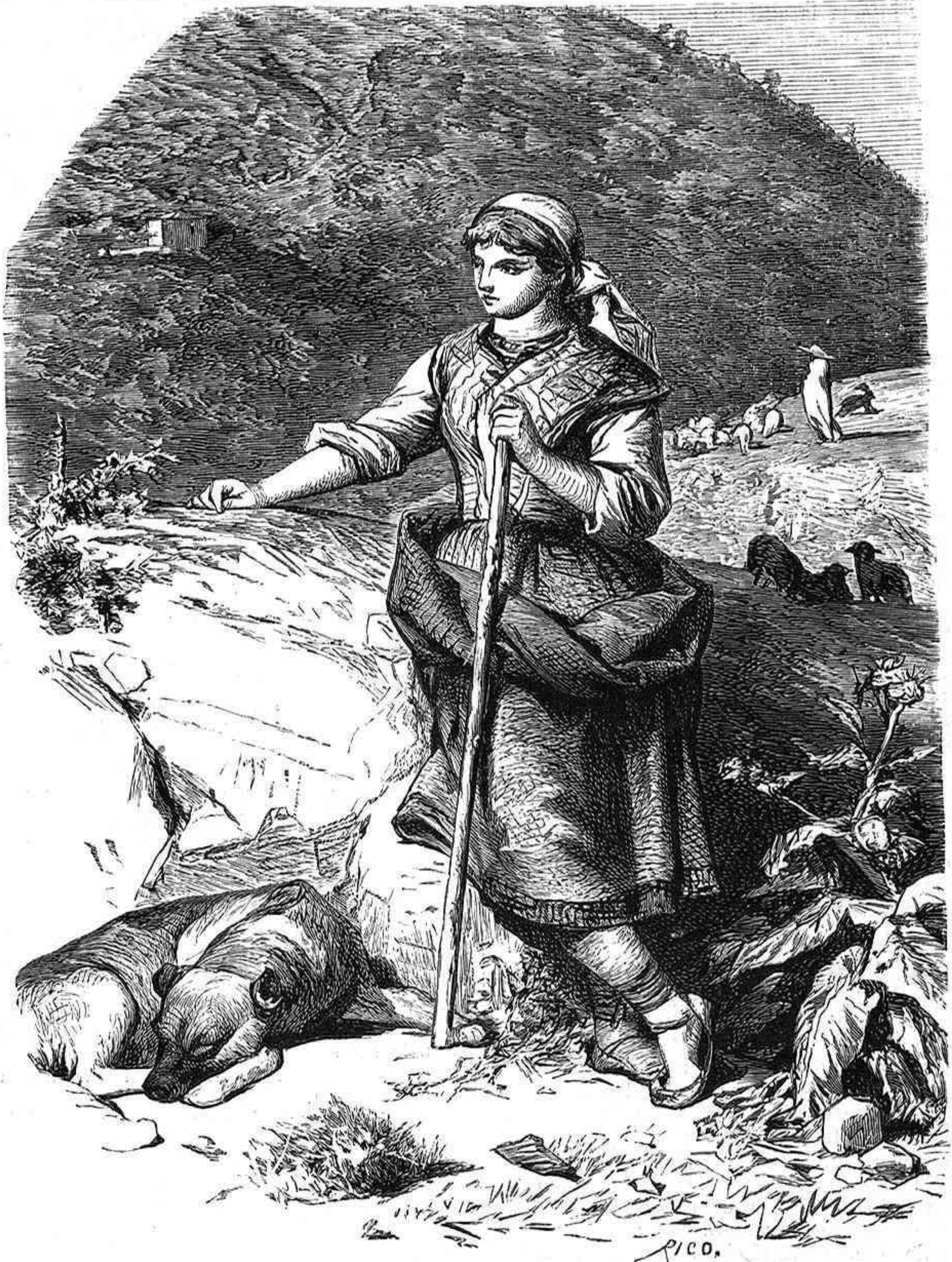
LA PASTORA.—TIPO ARAGONÉS.

Entre las condiciones que el marqués de Alcañices y Oropesa puso al hacer la cesion, fue la segunda, que al erigir la nueva fábrica se debie-