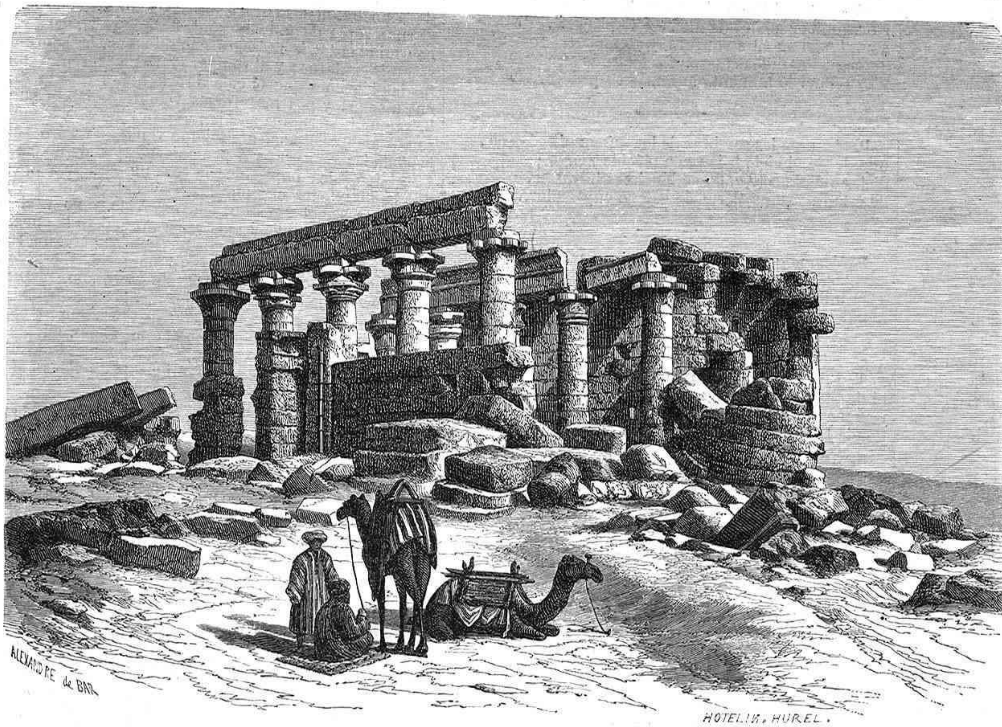
RUINAS DE MAHARAKKA, ANTIGUO TEMPLO DE LA NUBIA, EN LAS ORILLAS DEL NILO.