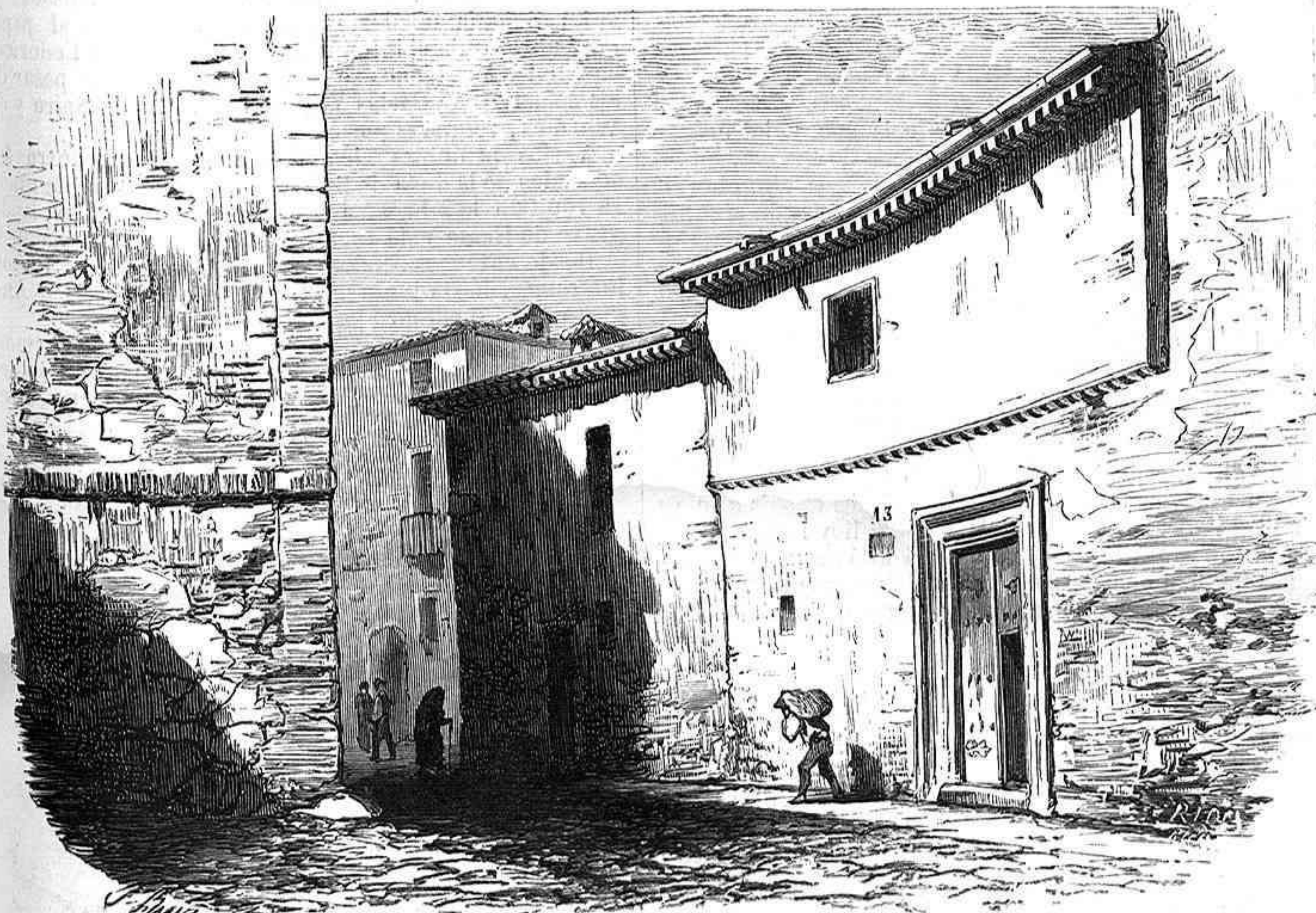
CALLE DE LA MORERIA.—MADRID VIEJO.