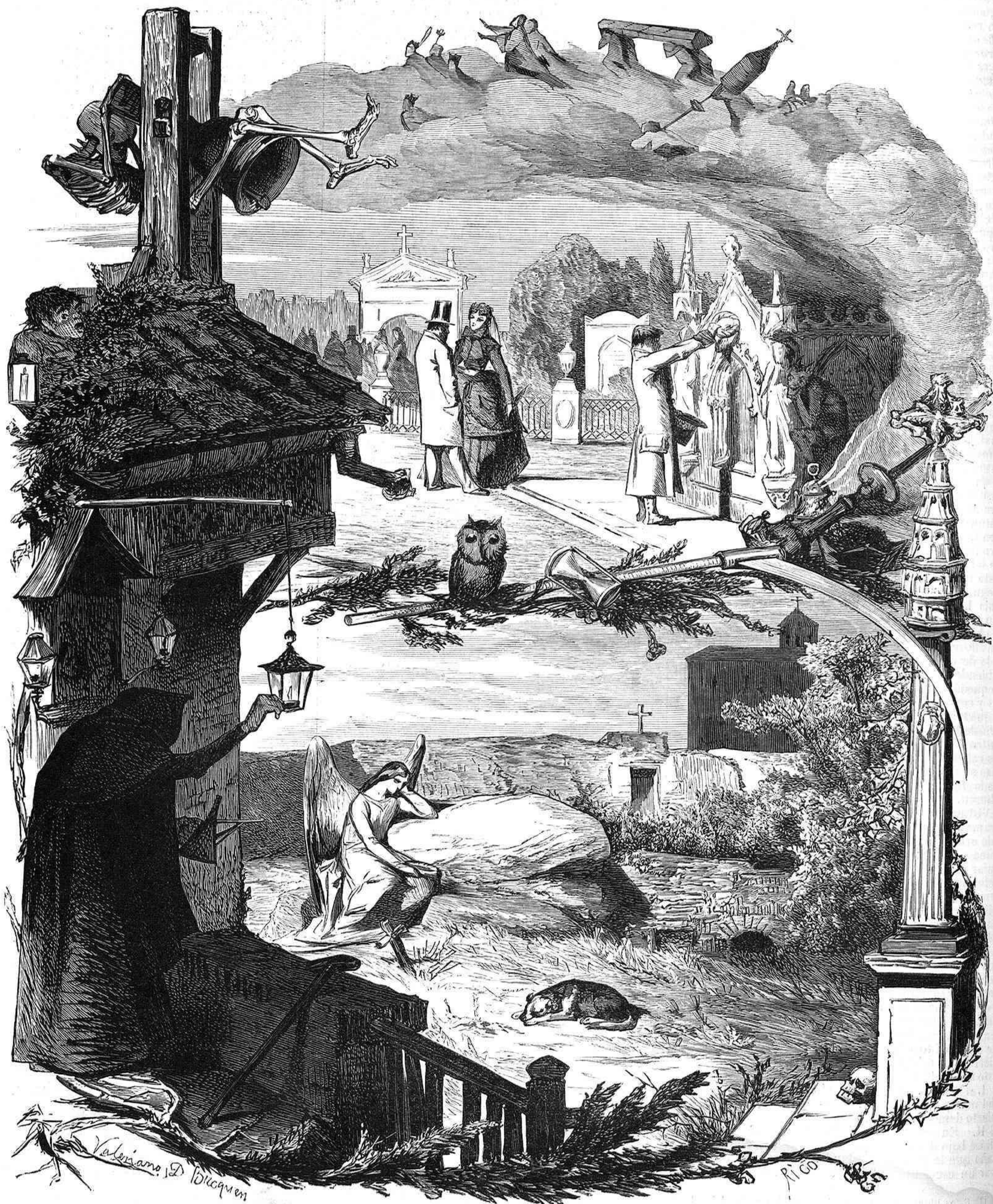
LA NOCHE DE DIFUNTOS.

perezosos cuadrúpedos, se desciende con extraordinaria velocidad al delicioso valle de Loyola, no sin pasar antes por la villa de Azcoitia, cuyo nombre en vascoense significa encima de la peña , á diferencia de la otra llamada Azpeitia, al extremo opuesto del valle, cuya equivalencia es debajo de la peña . Esta peña