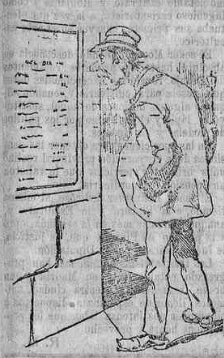
—Pues señor, como todos los días; Noble y Casanellas sin parecer. Como no estén esperando a que se reorganice la Policía para presentarse...

Ballestilla. Hoy, públicamente declarado inocente por el tribunal de justicia, tenemos la inmensa satisfacción de hacerlo constar desde estas columnas, como justa recompensa al que fué herido en su fama. El Corresponsal.