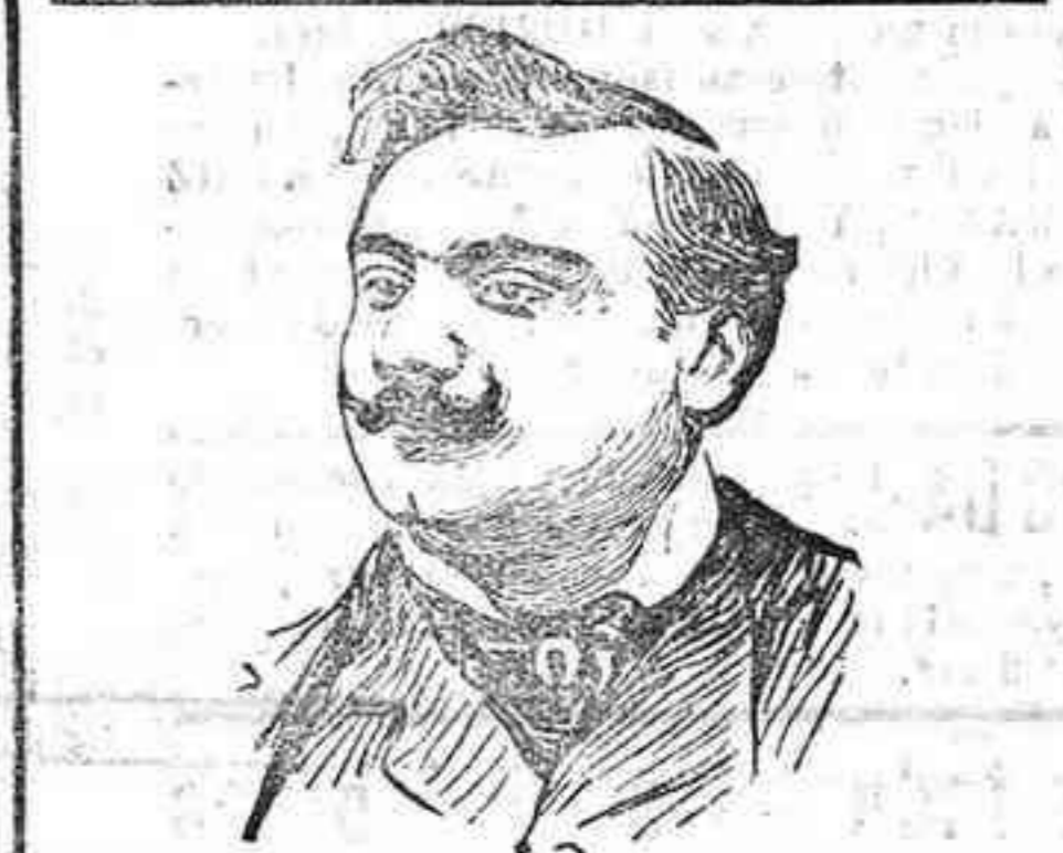
El célebre tenor Carruso, al que en su casa de Easthampton (New-York) le han sido robados $500.000 dólares y un collar valorado en 75.000 duros.

vacos, dando tres castalazos y perdiendo dos jacos en la redilega. Sarraute coge las banderillas y, al compás de la música, coloca un par de dentro a fuera, terminando Moras y Chava con dos y medio. Sarraute, coge la muleta, da algunos pases buenos, que sirven de prófalo para un plachazo, cuatro mantizas más y una estocada baja, que acaba con la vida del animal. Quinto.—Negro, chiquillo, pero con buenas defensas. Caracortis varoniquen bien y eye palmas. Los caballos tienen la piel en tres castalazos dando dos castalazos y perdiendo un arra. Alpargatero y Playa clavan tres pares de banderillas. Caracortis hace una buena faena de muleta en la que intercala dos pases de pecho superiores, aprovechando, entra a matar para media estocada delatada y castar; sigue matando valiente y entrando nuevamente, agarra otra media buena que hace reír al bicho. Palmas. Sexto.—Negro como el anterior y con dos velos respetables. Joselito da al animal tres verónicas, terminando con media buena. Palmas. De los del castoreño to ma el bicho cuatro puyazos a cambio de otras tantas caídas. Lavate y Dion adornan el morrillo del animal con cuatro pares de garapillos. Joselito coge los arcos de matar y da algunos muleta que no lecan a causa de que el bicho se las raja a cada pase; en cuanto el animal se para, aprovecha el machocho y entrando derecho agarra una superior estocada que acaba con la vida del animal y con la corrida, que ha resultado de aburridísima.