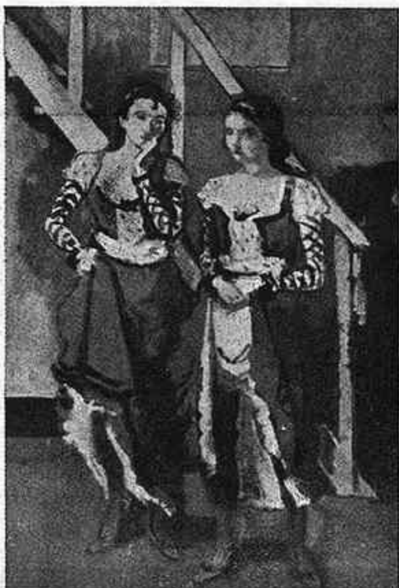
Briançon - «Danseuses du French Cancans»

Seguint galeries, entrem a can Rosenberg, i ens trobem amb una antiga conec-