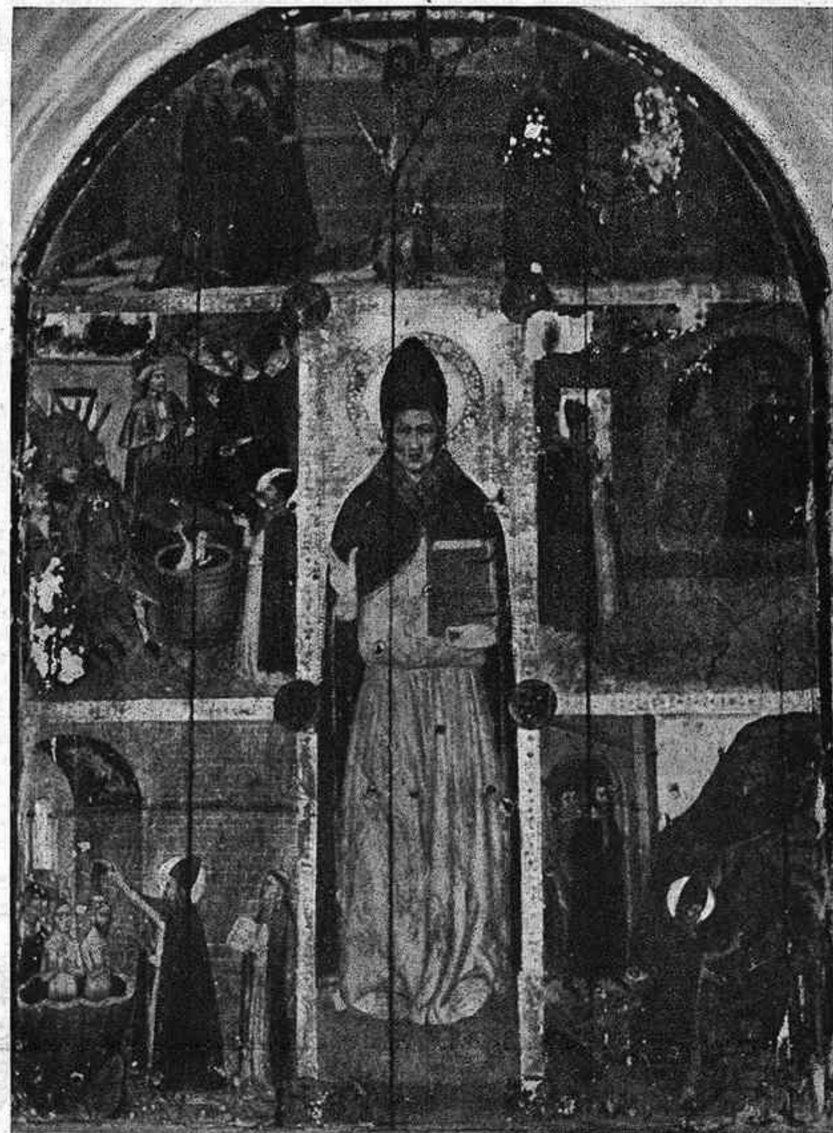
Retaule de Sant Silvestre, de l'església de Sant Sebastià de Montmajor, prop de Sant Feliu de Codines.—1'50 x 2 m.—(Foto Jaume Comes)

Però hi havia també a l'exposició del Centre Excursionista Casanova el retaule de Santa Agnès de Malanyanes, obra interessantíssima, sobretot des del punt de vista arqueològic; perquè es tracta d'una bona pintura catalana del segle XVI, i ja és prou sabut que fins fa poc hom deia i escrivia si la pintura catalana havia mort amb el segle XV.