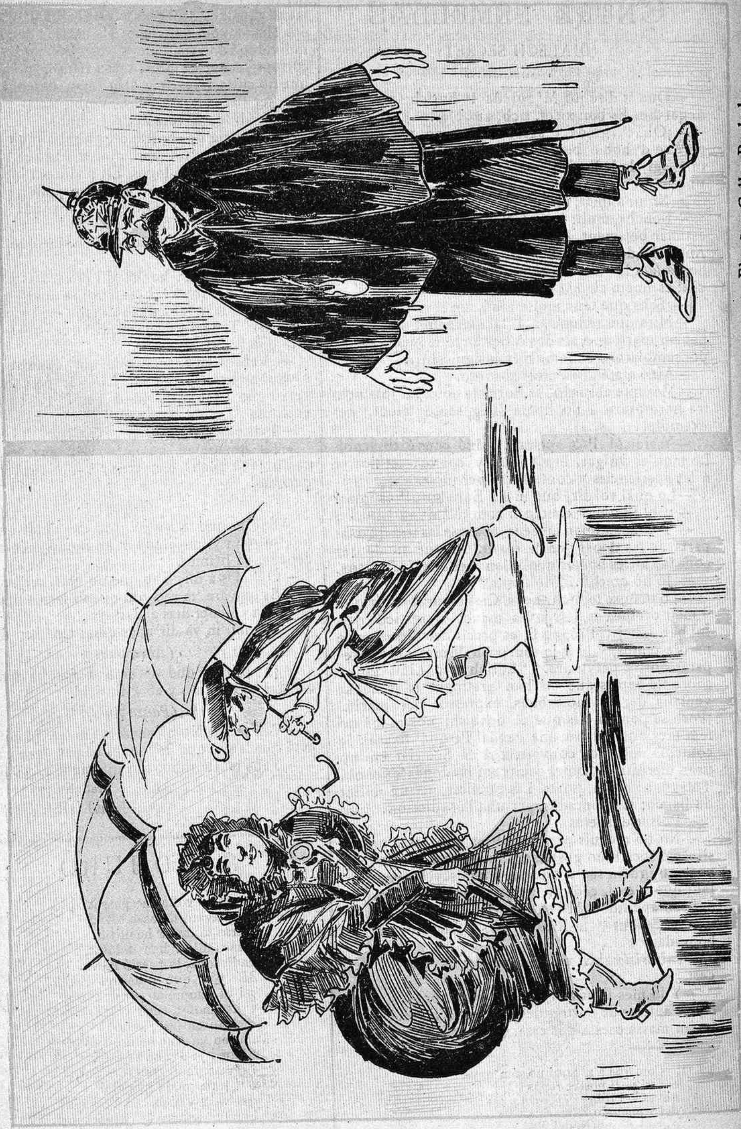
Ab las darrerars molleñas s' ha observat que las fardillas cubrenen distintas midas de místicas pantorrillas.