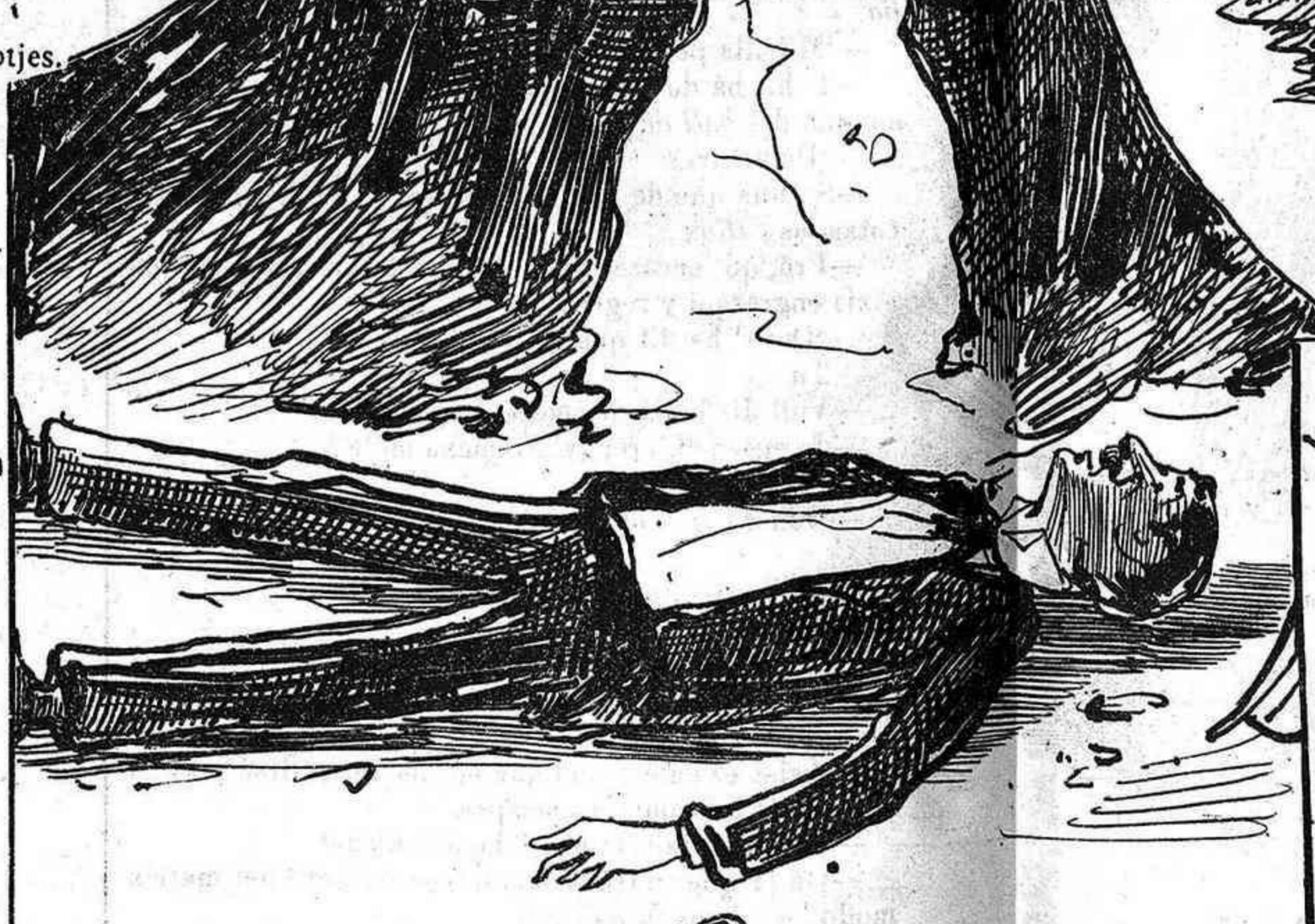
Pera pegarshi un tiro.