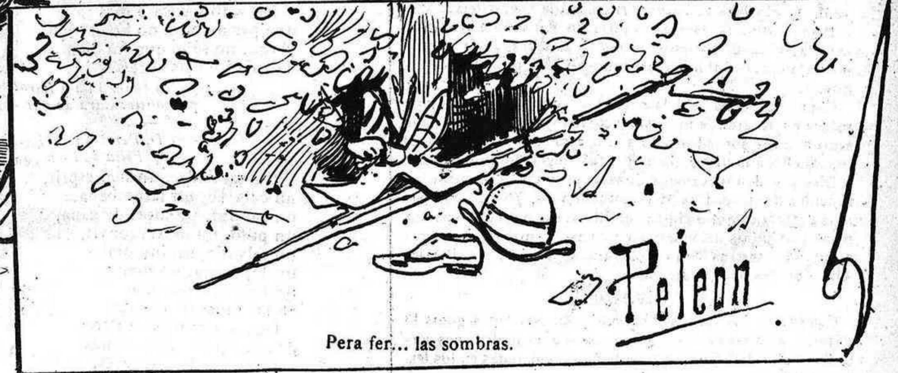
Pera fer... las sombras.