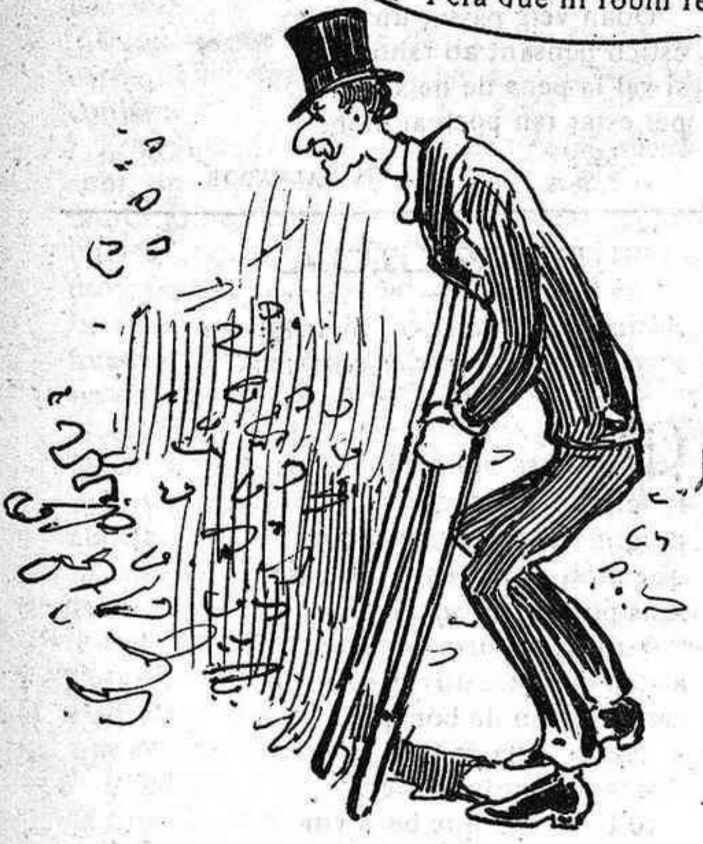
Pera agafarhi un doló reumátich.