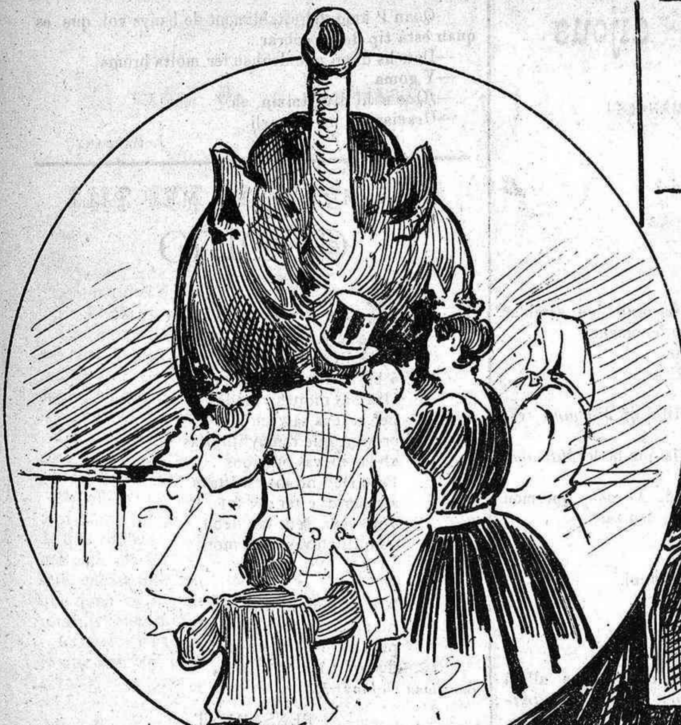
Pera que hi robin rellotjes.