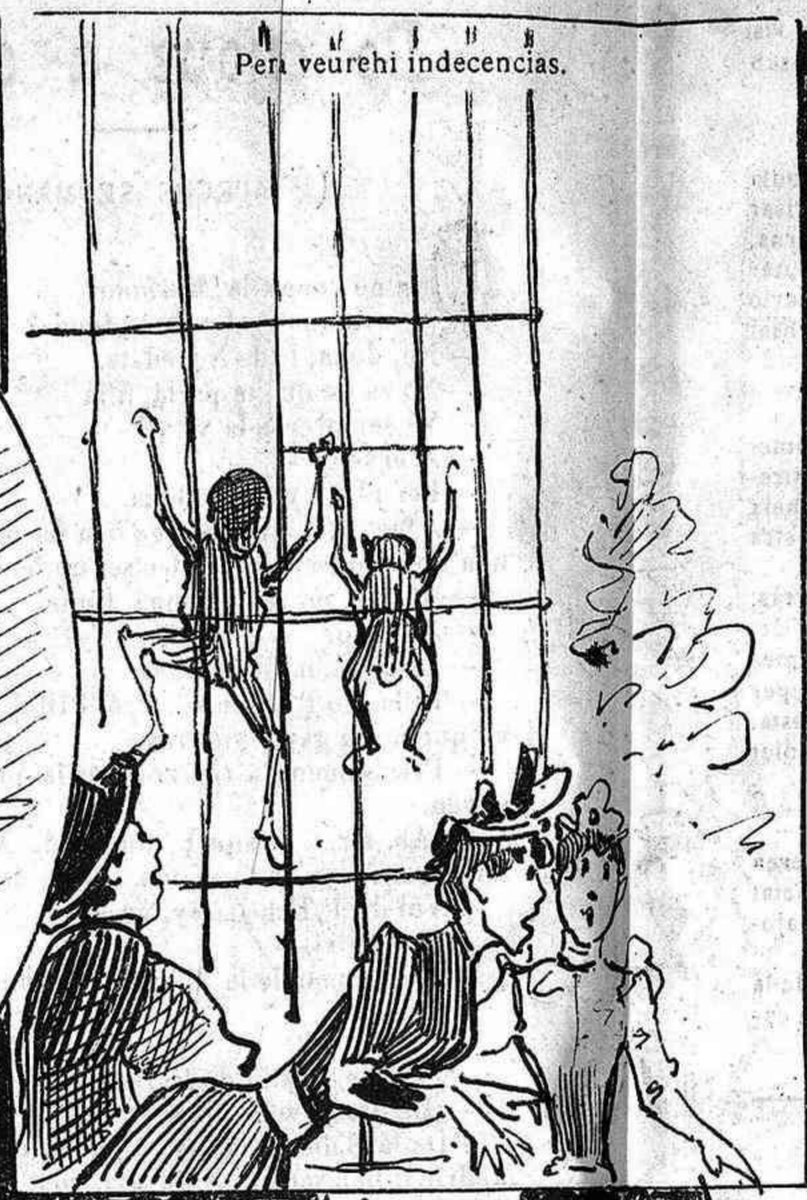
Pera veurehi indecencias.