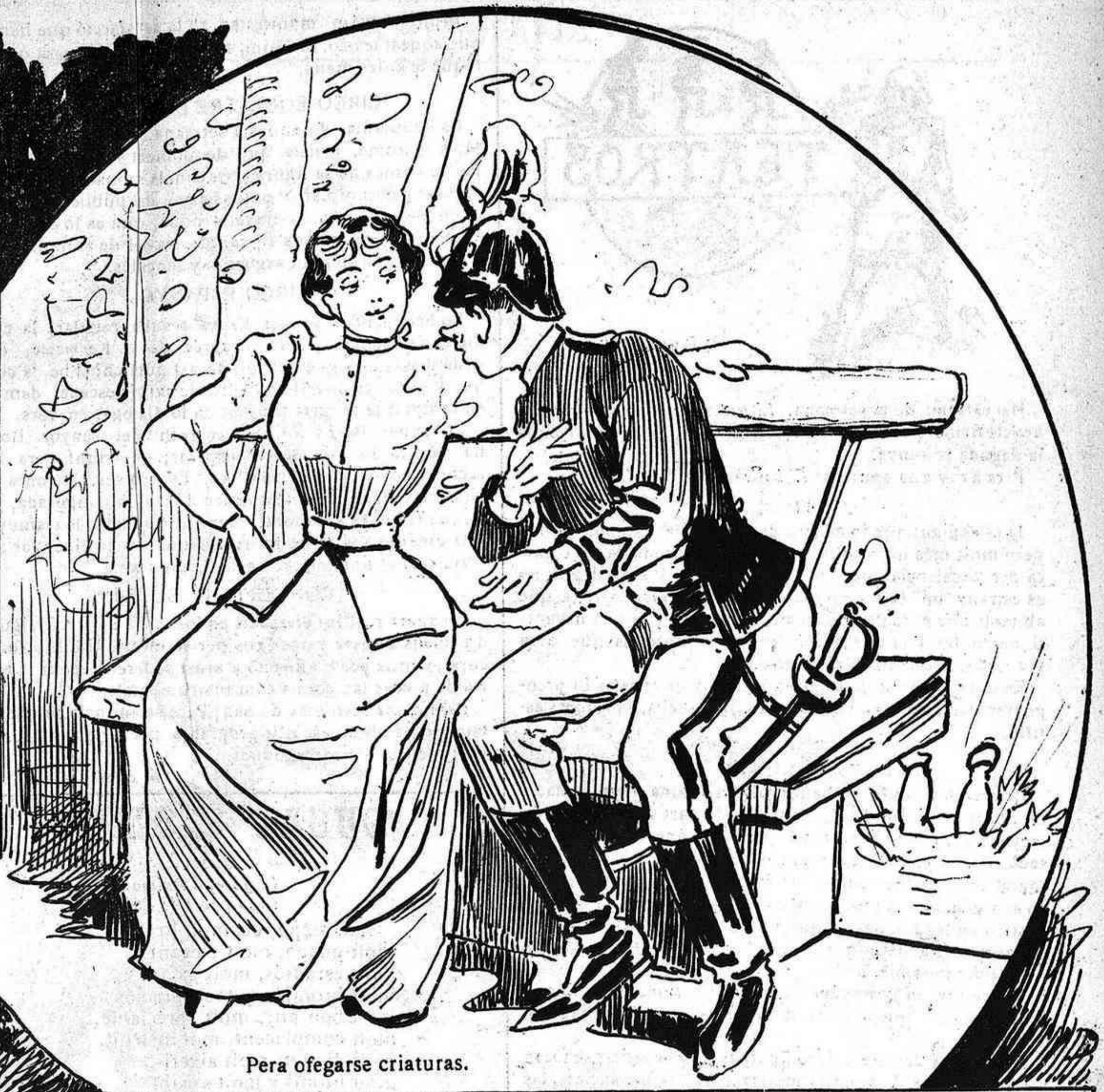
Pera ofegarse criaturas.