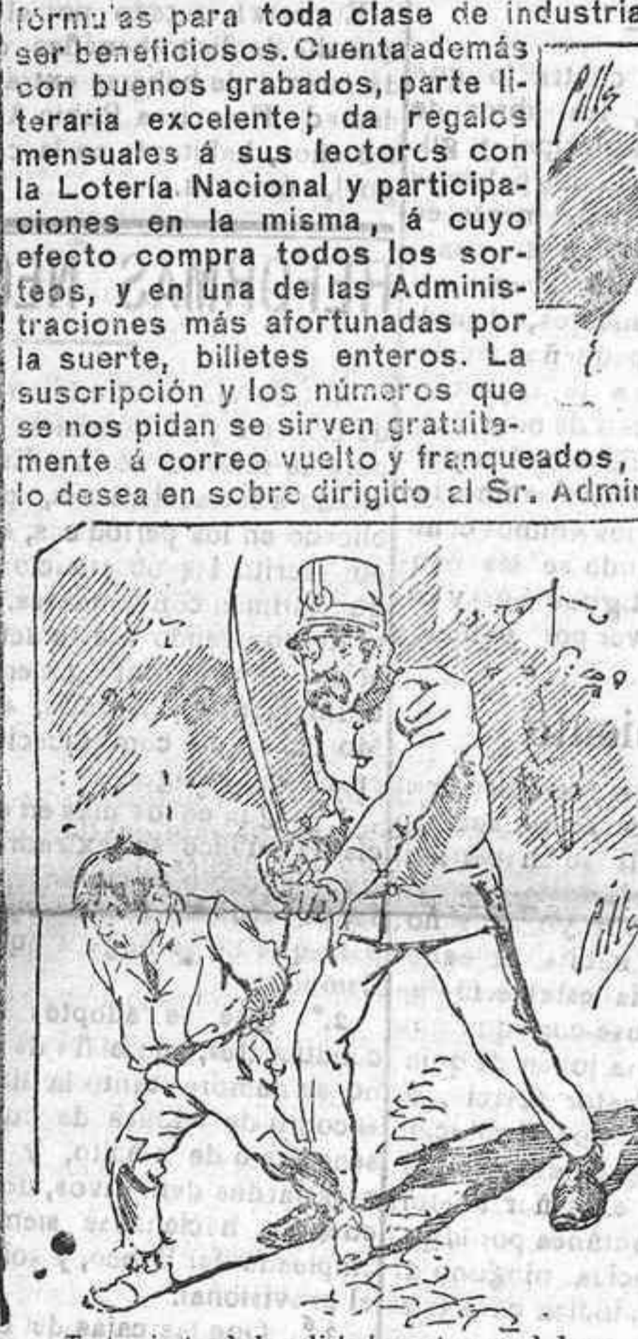
Tratamiento de la polifolia á nuestros vendedores cuando el número pica...