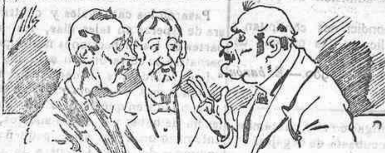
Abominan á nuestros libros... pero los compran.

Todas las personas de gusto, curiosas é ilustradas, deben pedir al Director de LA AVISPA, apartado núm. 8, MADRID, un ejemplar que se remite gratis y franqueado. Esta Revista Enciclopédica Popular publica recreaciones científicas, recetas de cocina, repostería, confitería, vinos, licores, pinturas, barnices, betunes y fórmulas para toda clase de industria, y cuantas noticias y conocimientos puedan ser beneficiosos. Cuenta además con buenos grabados, parte literaria excelente, da regalos mensuales á sus lectores con la Lotería Nacional y participaciones en la misma, á cuyo efecto compra todos los sorteos, y en una de las Administraciones más afortunadas por la suerte, billetes enteros. La suscripción y los números que se nos pidan se sirven gratuitamente á correo vuelto y franqueados, con sólo indicar el nombre y dirección de lo desea en sobre dirigido al Sr. Administrador de